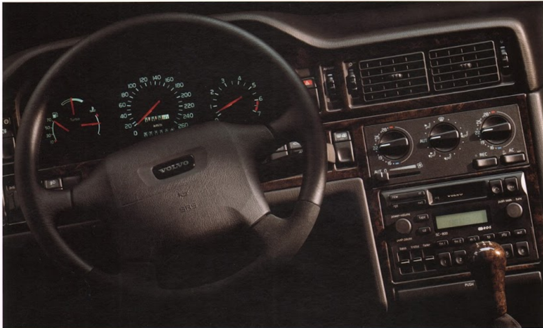
AUTOMATISK KLIMATANLÄGGNING (ECC).

240 HK. SPORTRATT. KRAFTFULL MUSIKANLÄGGNING. PANELER OCH VÄXELSPAKSKNOPP I MÖRK VALNÖTSROT.