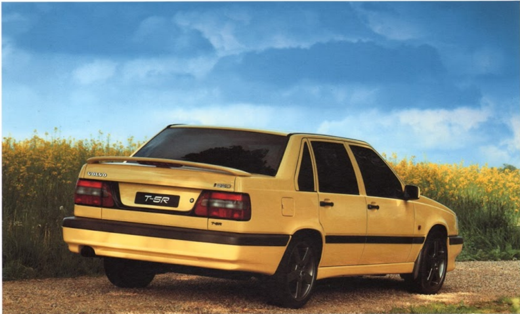
0-100 KM/TIM PÅ 6,9 SEK. ALUMINIUMFÄLGAR 7x17".

240 HK. SPORTRATT. KRAFTFULL MUSIKANLÄGGNING. PANELER OCH VÄXELSPAKSKNOPP I MÖRK VALNÖTSROT.