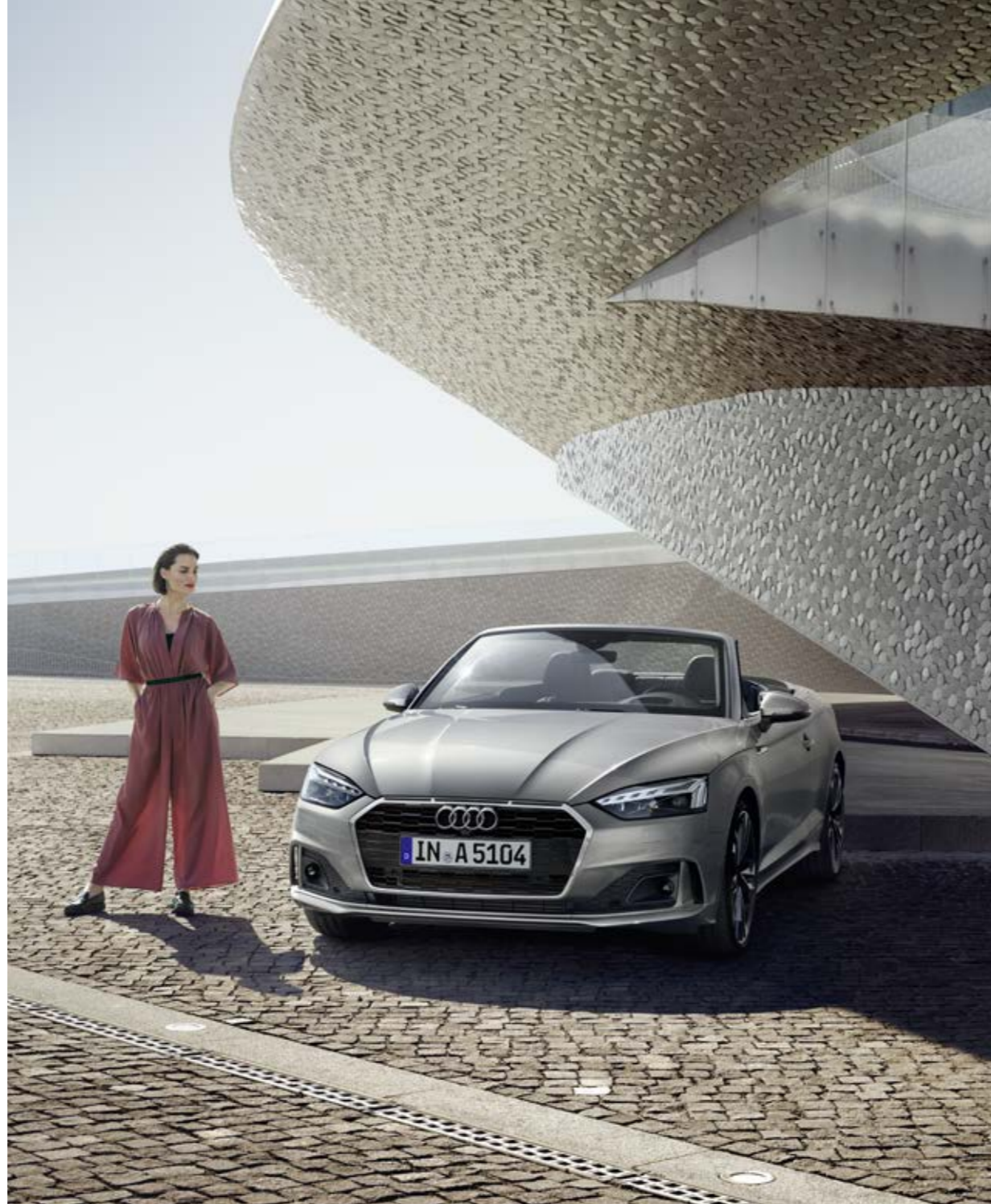
Audi A5 Cabriolet

Hodnoty spotreby paliva a emisií CO 2 nájdete na strane 34. Uvedené prvky výbavy sú čiastočne prvkami zvláštnej výbavy za príplatok. Podrobné informácie o sériovej a zvláštnej výbave získate na www.audi.com alebo u vášho partnera Audi.