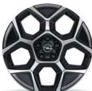
18" zliatinové disky Pentagon, čierne s výbrusom Diamond Cut a šedými prvkami