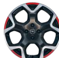
18" zliatinové disky Pentagon s výbrusom Diamond Cut s červenými prvkami