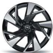
17" zliatinové disky Kadet, čierne s výbrusom Diamond Cut