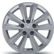
16" zliatinové disky Phantom