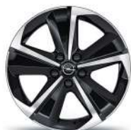
17" zliatinové disky Admiral, čierne s výbrusom Diamond Cut