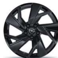
17" zliatinové disky Kadet, čierne