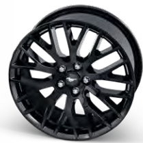
5.0L V8 GT Performance pack wheel