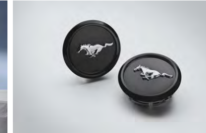
ชุดฝาครอบล้อ Mustang