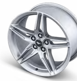
ล้ออัลลอยอลูมิเนียมแบบ Forged ขนาด 19" x 9" (Pre-Order) ล้ออัลลอยอลูมิเนียมแบบ Forged ขนาด 19" x 9.5" (Pre-Order)