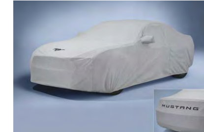
ผ้าคลุมรถ Mustang