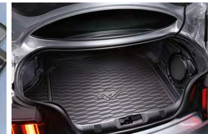
ถาดใส่ของท้ายรถ