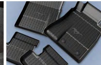
ชุดพรมปูพื้นพร้อมโลโก้ Mustang