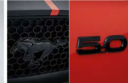
Mustang badge และ 5.0 badge สีดำ (Pre-Order)