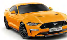
Orange Fury Metallic Tri-Coat