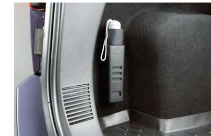
ที่เก็บรถ