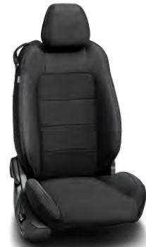
เบาะหนังสีดำ (Ebony leather)