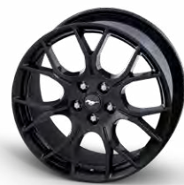
EcoBoost Performance pack wheel