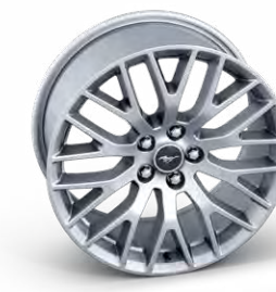
ล้ออัลลอยอลูมิเนียมคู่หน้า ขนาด 19" x 9" (Pre-Order) ล้ออัลลอยอลูมิเนียมคู่หลัง ขนาด 19" x 9.5" (Pre-Order)