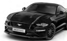
Shadow Black Metallic