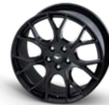
EcoBoost Performance Pack Wheel