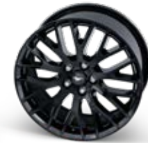
5.0L V8 GT Performance Pack Wheel