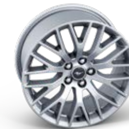
ล้ออัลลอยอะลูมิเนียมคู่หน้า ขนาด 19" x 9" (Pre-Order) ล้ออัลลอยอะลูมิเนียมคู่หลัง ขนาด 19" x 9.5" (Pre-Order)