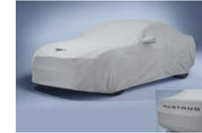
ผ้าคลุมรถ Mustang