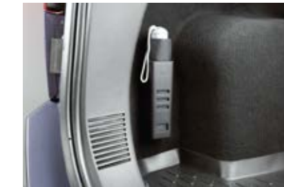
ที่เก็บร่ม