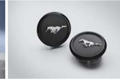
ชุดฝาครอบล้อ Mustang