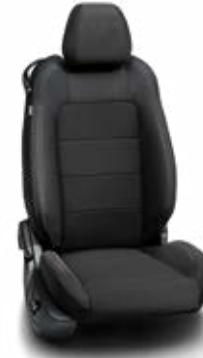
เบาะที่นั่งคู่หน้าปรับไฟฟ้า