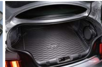
ถาดใส่ของท้ายรถ