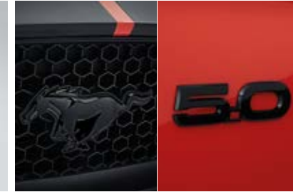
Mustang badge และ 5.0 badge สีดำ (Pre-Order)