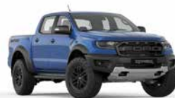
Ford Performance Blue*