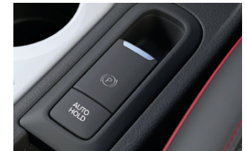
Electronic Parking Brake with Auto Hold