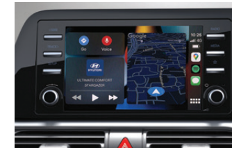
8" Display Audio with Smartphone Connectivity

เบาะนั่งหนังนิ่มสีตัวพร้อมตกแต่งด้วยแถบสีแดง 6 ที่นั่ง