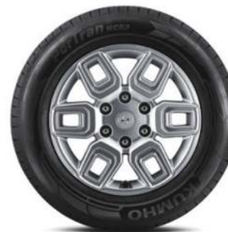
17" Alloy" 215/65 R17