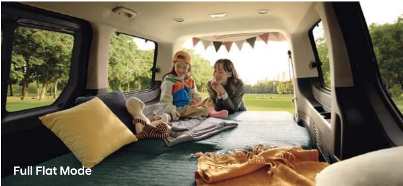
Full Flat Mode

ม่านกรองแสงสำหรับห้องโดยสารตอนหลัง ช่วยลดอุณหภูมิในห้องโดยสารจากความร้อนและแสงแดด ถูกซ่อนไว้อย่างเนบสนิก เพื่อไม่ให้คนบังทัศนวิสัย