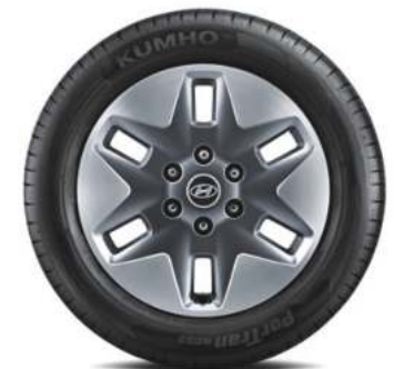
18" Alloy" 235/55 R18