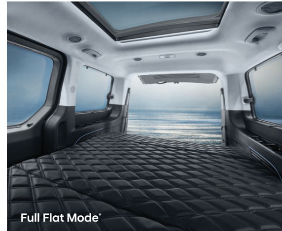
Full Flat Mode*