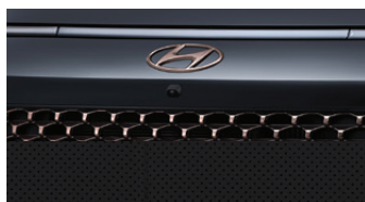
Abyss Black Pearl with Tinted Brass / Black Monotone