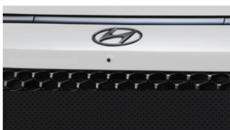
Creamy White with Dark Chrome / Black Monotone