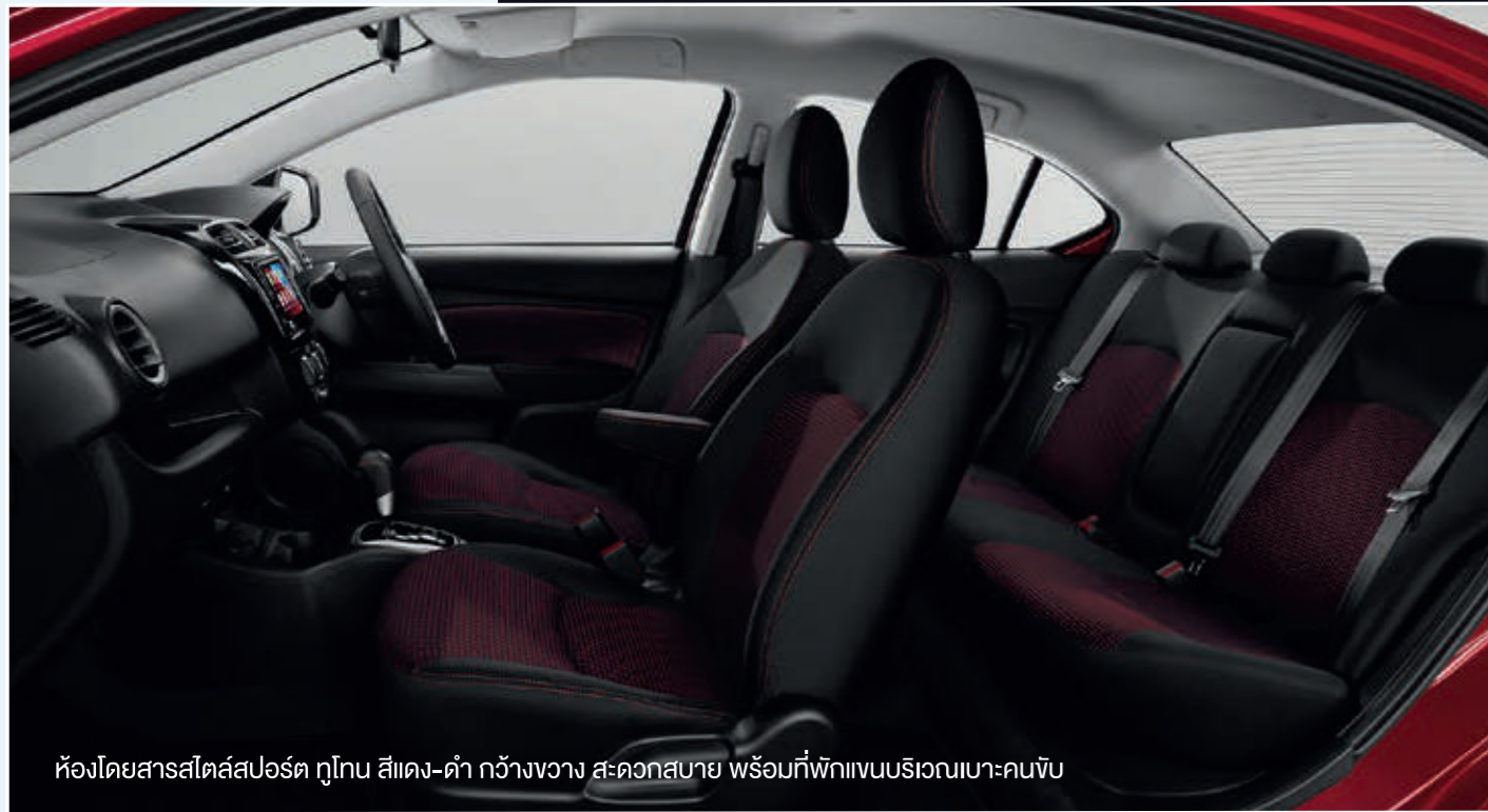
ห้องโดยสารสไตล์สปอร์ต ภูเขา สีแดง-ดำ กว้างขวาง สะดวกสบาย พร้อมทั้งพิกเนนริเวณเบาะคนขับ