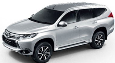
NEW U25 / STERLING SILVER (M)