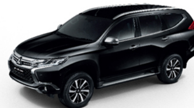
X08 / PYRENESS BLACK (P)