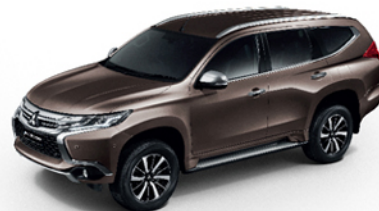
NEW C17 / DEEP BRONZE (M)