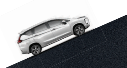
▶ HILL START ASSIST (HSA) ระบบช่วยออกตัวบนทางลาดชัน ช่วยป้องกันรถไหล

เพราะความปลอดภัย คือสิ่งสำคัญที่สุด... ให้คุณและครอบครัวมั่นใจได้ในทุกช่วงของการเดินทาง ด้วยเทคโนโลยีเพื่อความปลอดภัยที่ครบครัน