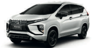
(W81) QUARTZ WHITE PEARL