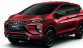
(P26) SPIRIT RED