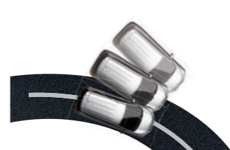
▶ ACTIVE STABILITY CONTROL (ASC) ระบบควบคุมเสถียรภาพการทรงตัวในสภาวะที่รถเสียสมดุล เพื่อป้องกันการลื่นไถลออกนอกเส้นทางเมื่อกำลังขับขี่ด้วยความเร็วสูง ถนนลื่น หรือหักหลบกะทันหัน