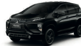
(X37) JET BLACK MICA