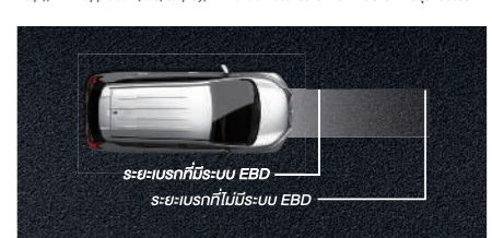
▶ ELECTRONIC BRAKE FORCE DISTRIBUTION (EBD) and BRAKE ASSIST (BA) ระบบกระจายแรงดันน้ำมันเบรกแบบอิเล็กทรอนิกส์ เพื่อให้เกิดการกระจายแรงเบรก ลดระยะเบรกให้สั้นลง และระบบเสริมแรงเบรกช่วยเพิ่มแรงดันน้ำมัน ให้การหยุดรถเป็นไปอย่างรวดเร็ว