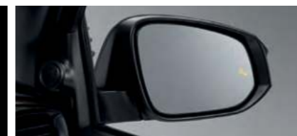
BSM (Blind Spot Monitor) ระบบช่วยเตือนมุมอับสายตา