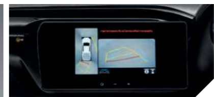
PVM (Panoramic View Monitor) กล้องมองรอบคัน 360 องศา