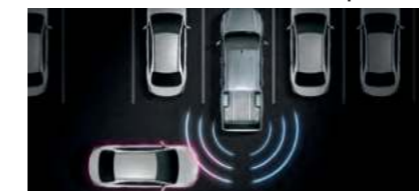
RCTA (Rear Cross Traffic Alert) ระบบช่วยเตือนขณะถอยรถ

SAFETY TECHNOLOGY (สำหรับรุ่นขับเคลื่อน 4 ล้อ)