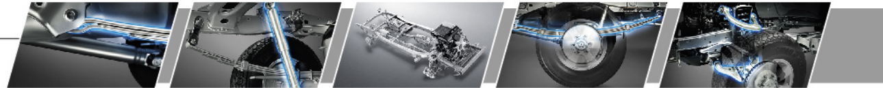
แหนบเบอร์ลินอาย (Berlin Eye Leaf Spring) โชคอัพ (Shock Absorber) แอสซีส์ปรับตัวตามสภาพถนน ความยาวของแหนบที่เหมาะสม ปีกนกคู่แบบอิสระ (Double Wishbone)

จับนุ่ม เข้าโค้งนิ่ง ทรงตัวแน่น ช่วงล่าง DTS เทคโนโลยีเอกสิทธิ์ของโตโยต้า ที่ออกแบบเฉพาะ ตอมทุกความหมายของการทรงตัวเหนือชั้นอย่างกระชับ-มั่นคง-แข็งแรง