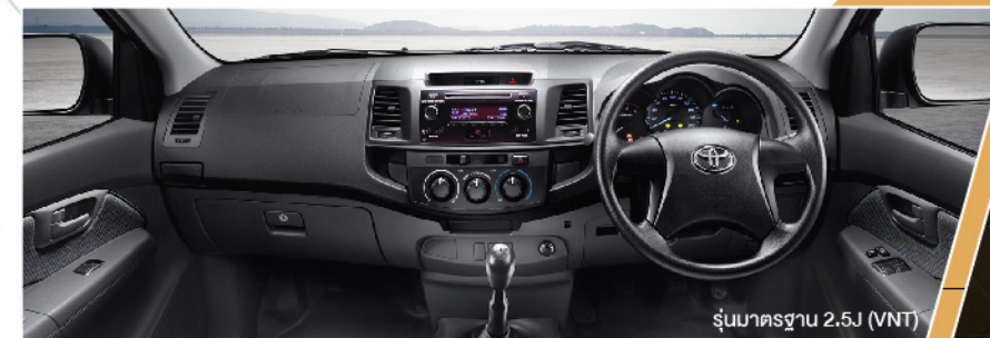
รุ่นมาตรฐาน 2.5J (VNT)