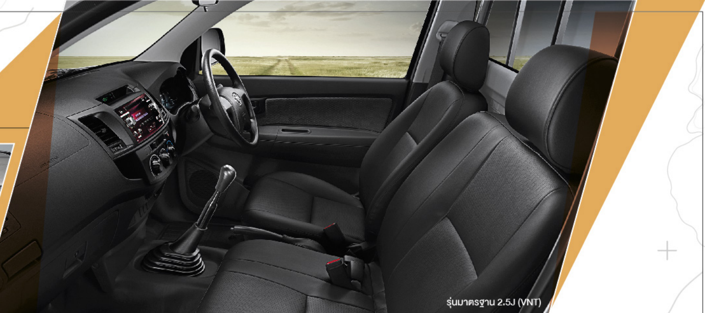
รุ่นมาตรฐาน 2.5J (VNT)