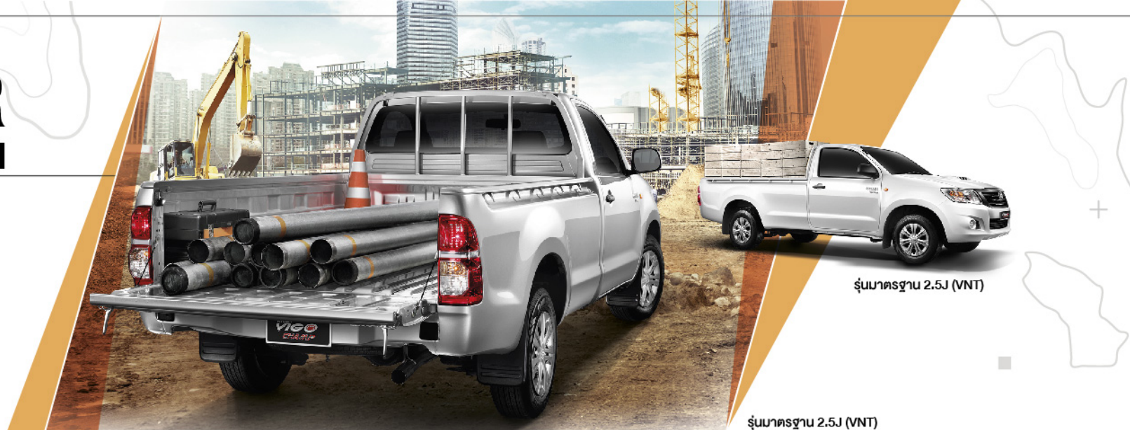
รุ่นมาตรฐาน 2.5J (VNT)