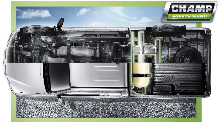
รูปโครงสร้างจากรุ่น สมาร์ท แค็บ

สวิตช์สั่งการระบบ CNG พร้อมจอแสดงผล (CNG Control Switch & Display) สะดวกสบายในการสั่งการระบบ CNG รวมถึงแสดงผลข้อมูลที่สำคัญต่างๆ ให้คุณทราบได้จากภายในห้องโดยสาร อาทิ ปริมาณ CNG ในถัง ค่าแรงดันก๊าซ ฯลฯ