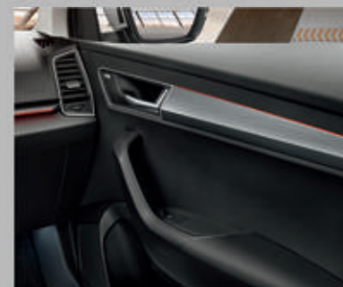
Eclairage d'ambiance rouge

Choisissez votre couleur préférée ou essayez chaque jour une nouvelle nuance. L'éclairage d'ambiance LED du tableau de bord et des portes avant, qui fait partie du pack LED, propose dix options de couleurs attrayantes. L'éclairage blanc de l'espace aux pieds est également inclus dans le pack LED.