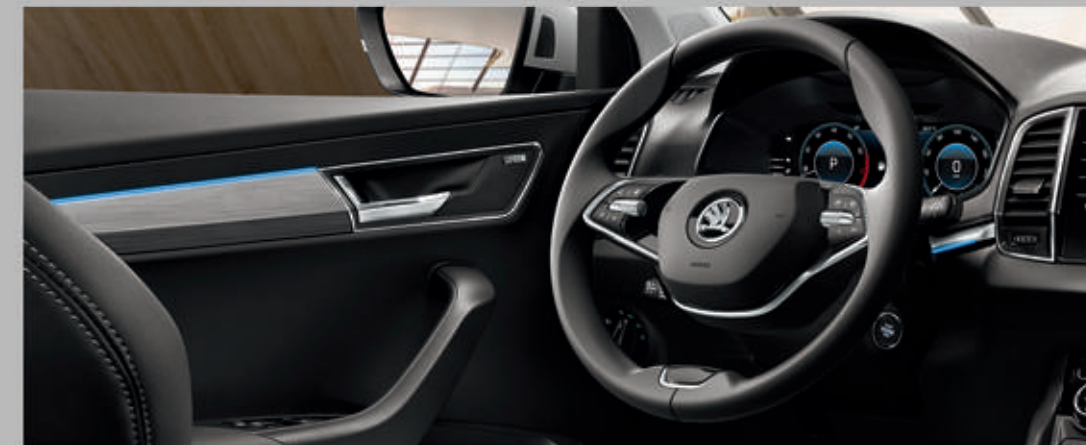
VOLANT EN CUIR MULTIFONCTION