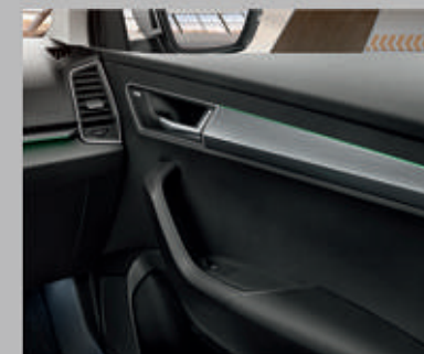
Eclairage d'ambiance vert