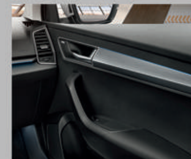
Eclairage d'ambiance bleu