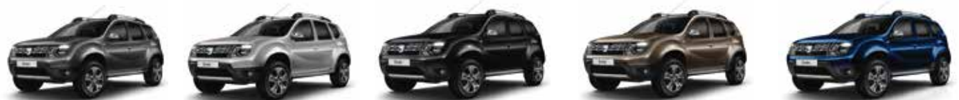
GRİ FÜME (KNA)