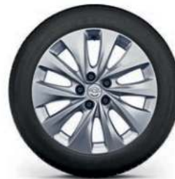
ELEGANCE ve ULTIMATE