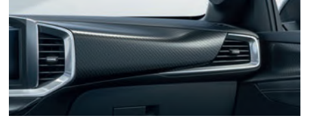
GS & ULTIMATE CHESS DEKOR & GRİ ÇERÇEVE