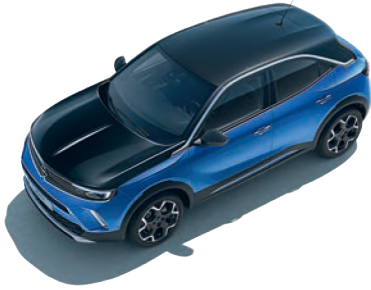
KARBON SİYAH KAPUT