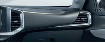
ELEGANCE ERİNO DEKOR & GRİ ÇERÇEVE