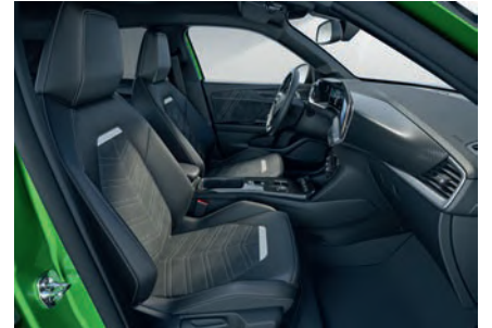
ULTIMATE ALCANTARA VE DERİ GÖRÜNÜMLÜ DÖŞEME