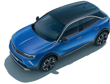
KARBON SİYAH TAVAN