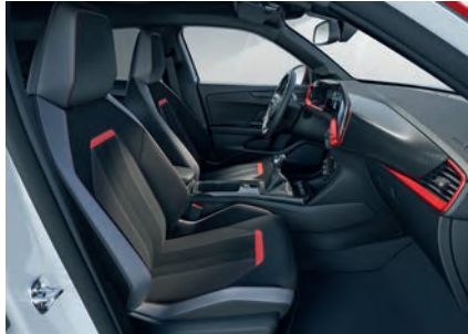
GS SİYAH KUMAŞ VE DERİ GÖRÜNÜMLÜ DÖŞEME