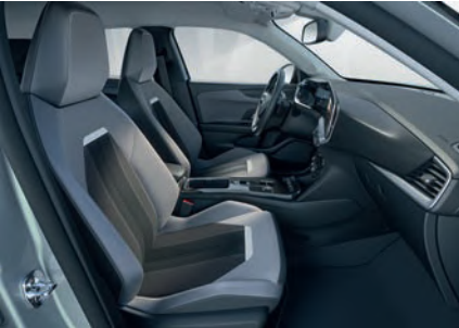
ELEGANCE GRİ & SİYAH KUMAŞ VE DERİ GÖRÜNÜMLÜ DÖŞEME