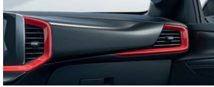
GS CHESS DEKOR & KIRMIZI ÇERÇEVE