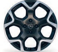
GS & ULTIMATE