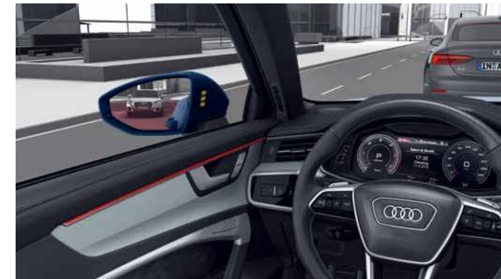
離車安全警示功能

後方橫向車流警示功能，會在針對可能與接近之橫向車流發生碰撞的情況，向乘客發出警示。