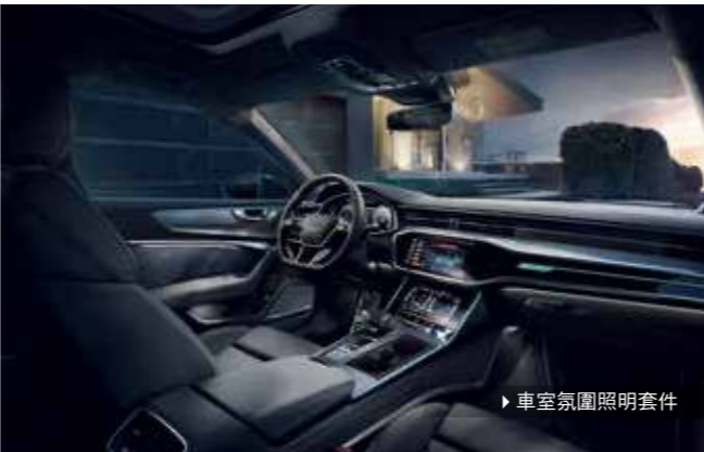
▶ 車室氛圍照明套件

輪廓/氛圍照明套件(能設定為不同色彩)，除了包含車室照明套件：包含三種預設色彩設定；額外的互動式自訂色彩設定。互動式色彩設定透過 Audi drive select 可程式車身動態系統不同模式控制，多達 30 種顏色可供您選取。