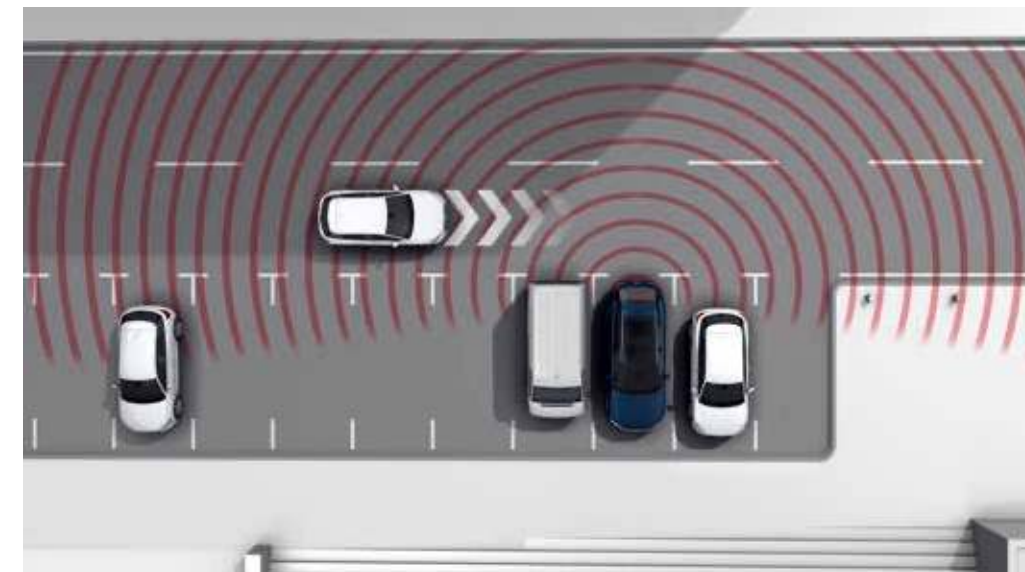
後方橫向車流警示

每個人都有可能遇到分心或疏忽的情況，左轉預警輔助會以煞車介入來防止與對向來車碰撞。