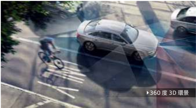
▶ 360 度 3D 環景

規格配備以實車為準，部分圖示和敘述的內容為選配，可能需要額外加價。請洽全台 Audi 授權經銷商取得標準及選購配備的詳細資訊。