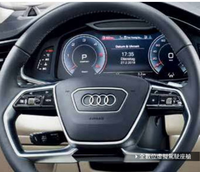
▶ 全數位虛擬駕駛座艙

您可以在車上儲存多種個人化的設定，例如座椅位置、資訊娛樂系統或底盤相關設定。透過 MMI 系統可儲存多達 6 組個人化以及一組來賓的設定。最後一組個人化設定的資料會指派給最後一次駕車並上鎖的鑰匙持有人。當車輛解鎖時，一組個人化的問候語將出現在 Audi 全數位虛擬駕駛座艙，同時相關設定會開始載入車輛。車輛設定的儲存項目須視選用配備而定。其他可儲存之設定包含：資訊娛樂系統、人體工學設定(座椅位置、車外後視鏡、方向盤位置)、車室燈光、空調系統、音響設定、駕駛者輔助系統、懸吊系統、頭燈系統、抬頭顯示器與儀表設定。