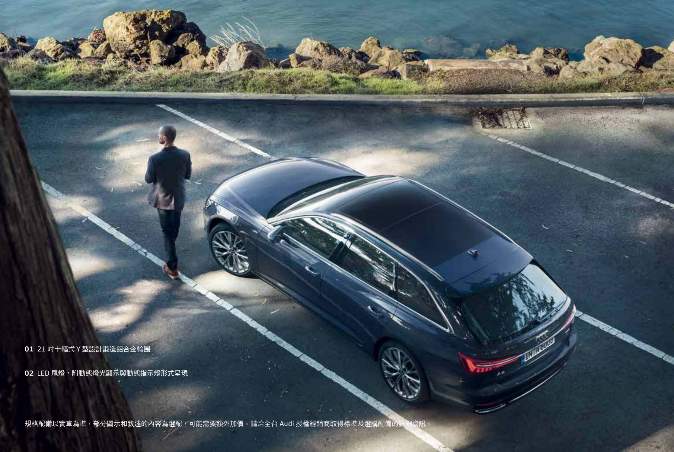
01 21吋十輻式Y型設計鍛造鋁合金輪圈