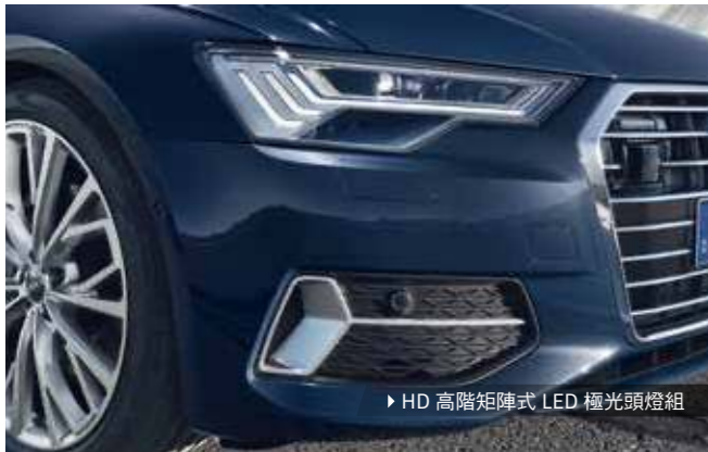
▶ HD 高階矩陣式 LED 極光頭燈組