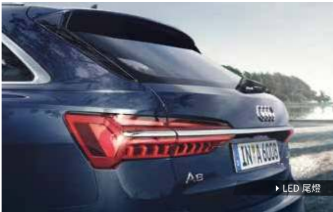
▶ LED 尾燈