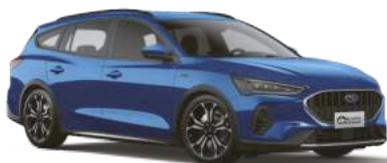
荒島藍 (IB) Desert Island Blue (Vignale 專屬車色)