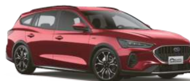
炫目紅 (DR) Candy Red