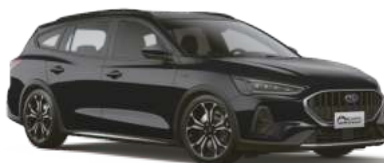
洗鍊黑 (BK) Absolute Black