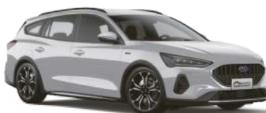
皓月白 (DW) Diamond White