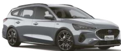
新世紀銀 (CS) New Century Silver