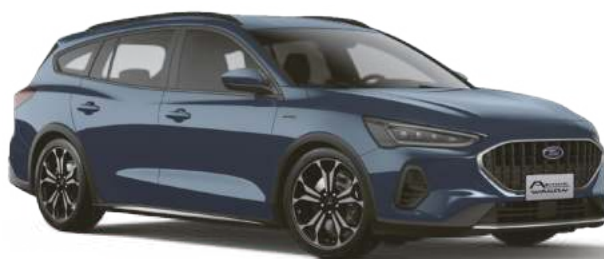
星燄藍 (BM) Blue Metallic