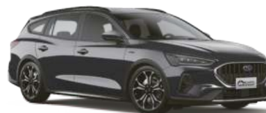
尊爵灰 (GO) Royal Ego