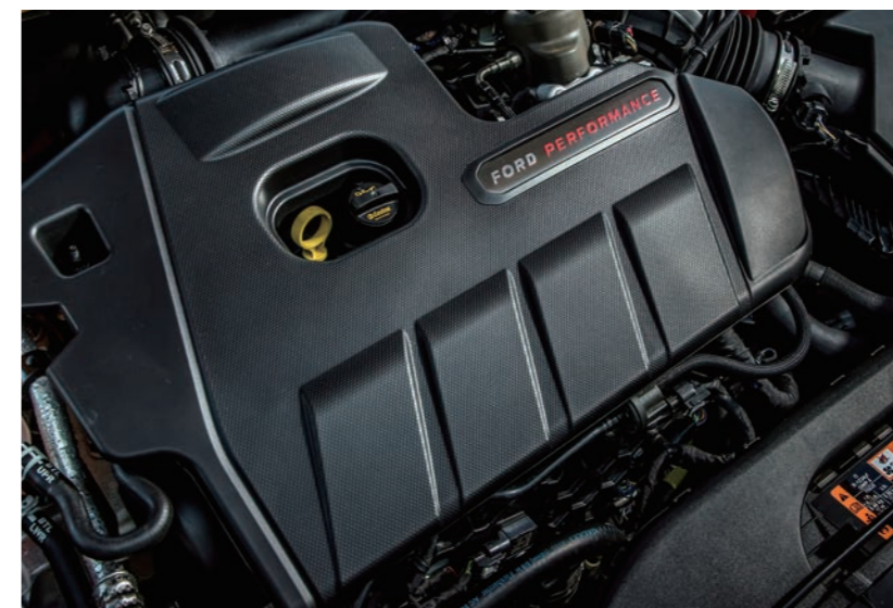
EcoBoost® 雙渦流渦輪增壓汽油引擎