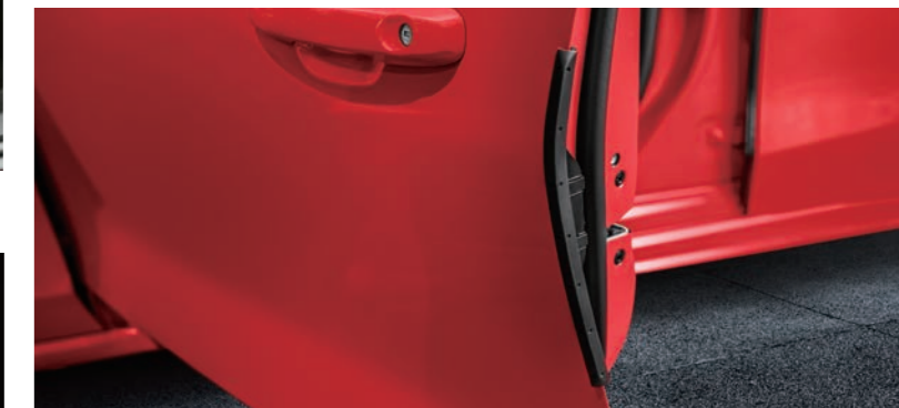
四門伸縮型防護邊條*