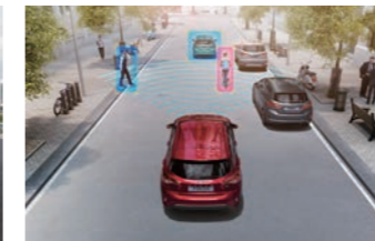
PCA 前向碰撞預警系統 (附 AEB 全速域輔助煞停系統)