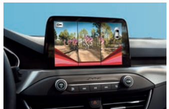
雙模式倒車顯影輔助系統 (一般及 180 度廣角)