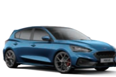
7L Ford Performance Blue