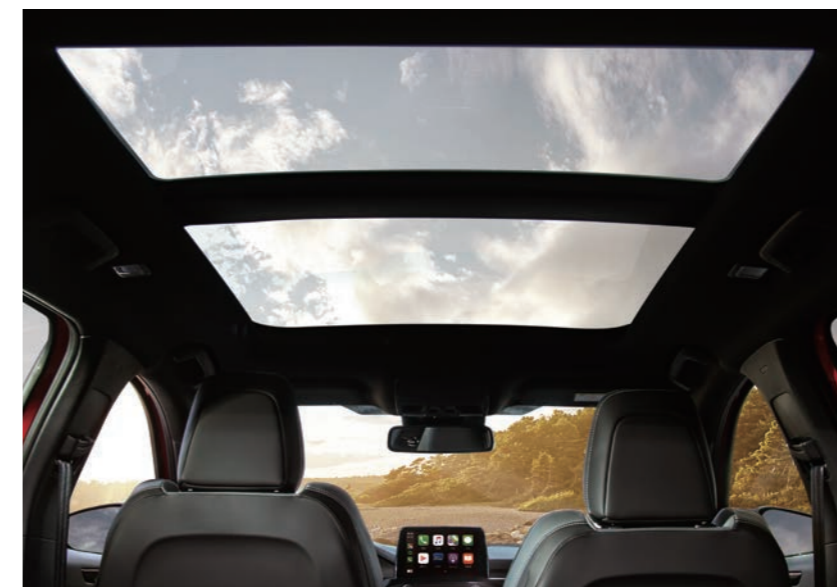
全景式大型電動天窗*