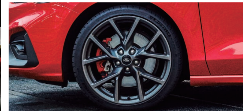
19 吋 Michelin Pilot Sport 4S 高性能跑胎* ST 專屬賽道級煞車系統（專屬紅色卡鉗 / 專屬加大碟盤）

* Hands-Free 足踢感應式電動尾門、AFS 頭燈主動式轉向照明輔助系統及旭日之刃型 LED 日行燈適用於 FOCUS ST WAGON 車型。 * 全景式大型電動天窗、四門伸縮型防護邊條及 19 吋 Michelin Pilot Sport 4S 高性能跑胎適用於 FOCUS ST WAGON 及 FOCUS ST 五門車型。* 此為展示車型，外觀樣式及內裝配備與實際上市車型有所差異，請以實際販售之車型及規格配備為準。