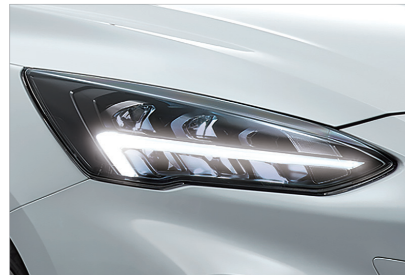
奪目之鑷型 LED 日行燈*

FOCUS ST WAGON – SLS Edition 致敬“HOME OF FOCUS” FORD 德國 Saarlouis 製造廠，自 1998 年推出第一代 FOCUS，迄今已在全球締造超過 20 年輝煌傳奇。烙以德國 Saarlouis 車籍代碼 SLS 之名，展現出身德製，熱血傳承德意志的純正血統；亦傳達 SPORTY & LIGHT STATION WAGON 性能調教的駕馭精髓，再次驅動你桀驁的靈魂。