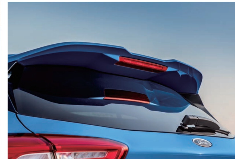
賽道級大型擾流尾翼