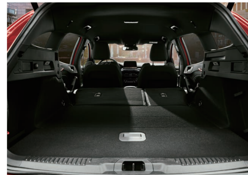
Hands-Free 足踢感應式電動尾門* / 行李廂後座快傾拉桿

以 ST 極致駕馭性能為名，德製高性能旅行車 FOCUS ST WAGON，擁有旅行車出色內置空間與絕美修長身形設計，完美兼具跑格與風格；配備行李廂後座快傾拉桿、足踢感應式電動尾門，讓旅程動感前行。德製高性能旅行車 FOCUS ST WAGON，為征服 Autobahn 而生，只願被你征服。