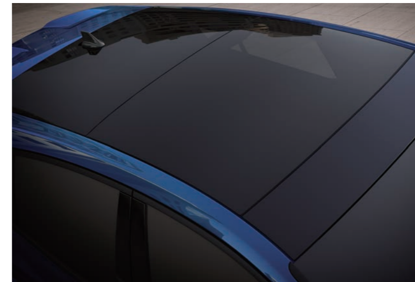
全景式大型電動車窗

德製性能鋼砲 FOCUS ST 的狂野，擁有雙車身線條設計搭配前後下擾流、側裙及賽道級大型擾流尾翼，競技型 Performance Pack 套件盡顯前驅性能鋼砲的不羈自信，動靜皆是王者風範。