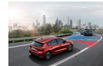
iACC 智慧型定速巡航調節系統 (附低速跟車) LCA 車道導正輔助系統

將規格相容的手機或使用相容充電背蓋的手機裝置放在車內的充電座上，即能輕鬆充電，無需使用傳輸線。