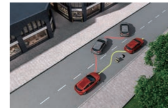
ESA 閃避轉向輔助系統