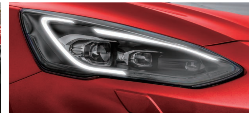
AFS 頭燈主動式轉向照明輔助系統* / 旭日之刃型 LED 日行燈*