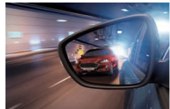
BLIS® 視覺盲點偵測系統 (附 CTA 倒車來車警示系統)