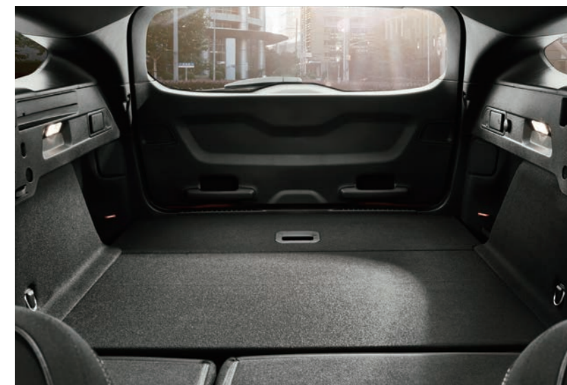
行李廂後座快傾拉桿*