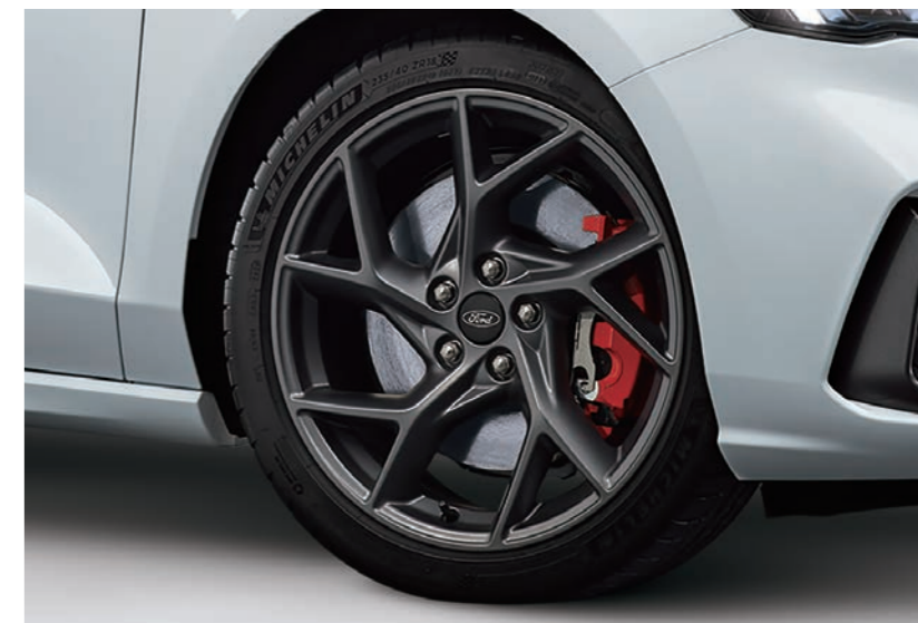
18 吋 Michelin Pilot Sport 4S 高性能跑胎* ST 專屬賽道級煞車系統（專屬紅色卡鉗 / 專屬加大碟盤）