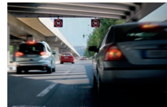
ISA 智慧型速限輔助系統 TSR 道路標誌識別輔助系統