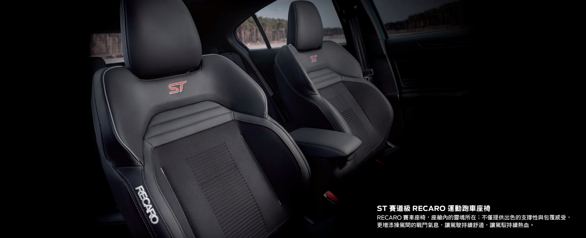
ST 賽道級 RECARO 運動跑車座椅 RECARO 賽車座椅，座艙內的靈魂所在；不僅提供出色的支撐性與包覆感受，更增添操駕間的戰鬥氣息，讓駕駛持續舒適，讓駕駛持續熱血。