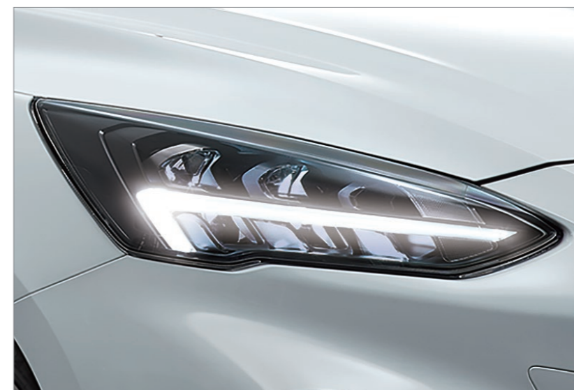
奪目之鑷型 LED 日行燈*

FOCUS ST WAGON – SLS Edition 致敬“HOME OF FOCUS” FORD 德國 Saarlouis 製造廠，自 1998 年推出第一代 FOCUS，迄今已在全球締造超過 20 年輝煌傳奇。烙以德國 Saarlouis 車籍代碼 SLS 之名，展現出身德製，熱血傳承德意志的純正血統；亦傳達 SPORTY & LIGHT STATION WAGON 性能調教的駕馭精髓，再次驅動你桀驁的靈魂。