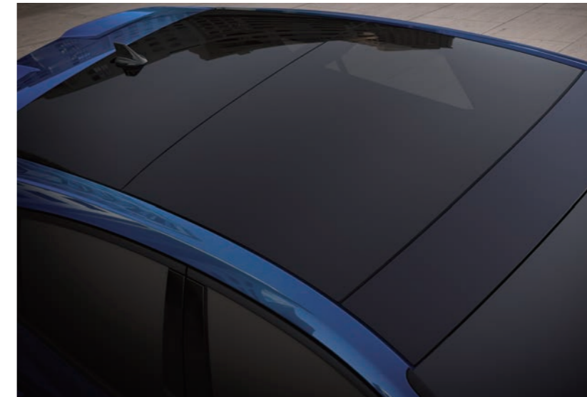
全景式大型電動車窗

德製性能鋼砲 FOCUS ST 的狂野，擁有雙車身線條設計搭配前後下擾流、側裙及賽道級大型擾流尾翼，競技型 Performance Pack 套件盡顯前驅性能鋼砲的不羈自信，動靜皆是王者風範。