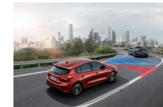
IACC 智慧型定速巡航調節系統 (附低速跟車) LCA 車道導正輔助系統

將規格相容的手機或使用相容充電背蓋的手機裝置放在車內的充電座上，即能輕鬆充電，無需使用傳輸線。