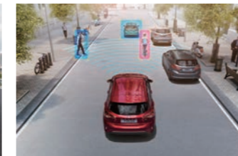
PCA 前向碰撞預警系統 (附 AEB 全速域輔助煞停系統)