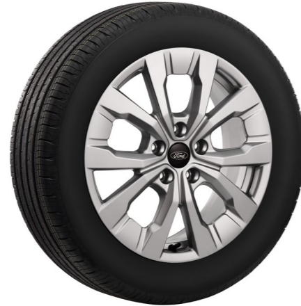
玩咖版 17 吋鋁圈