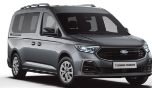
石墨灰 (8G) Graphite Grey