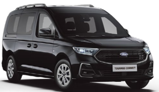
新月黑 (5B)* Ink Black