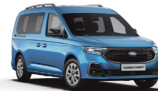
湖光藍 (4L) Boundless Blue