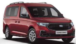
辰砂紅 (8H)* Maple Red