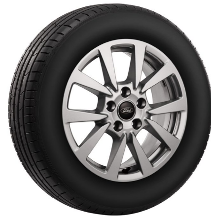
玩樂版 16 吋鋁圈