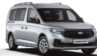
星塵銀 (5C) Stardust Silver