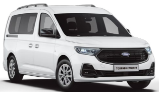
極地白 (5W)* Frozen White