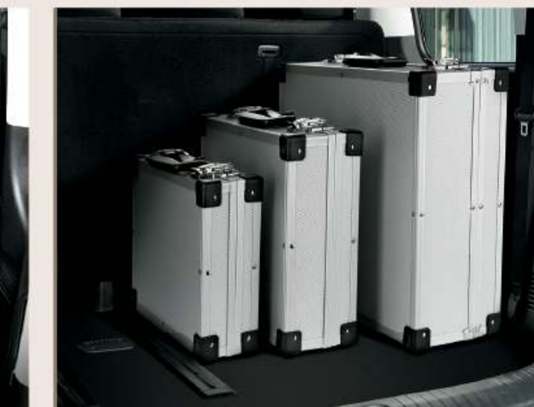
最大 1,303L 行李廂空間 / 長滑軌前後挪移（第二及第三排）