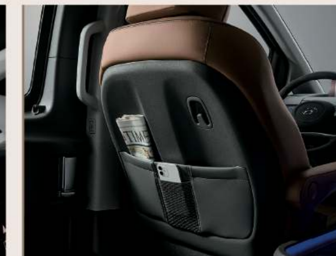
第二排前方椅背掛勾 地圖袋及專屬手機袋