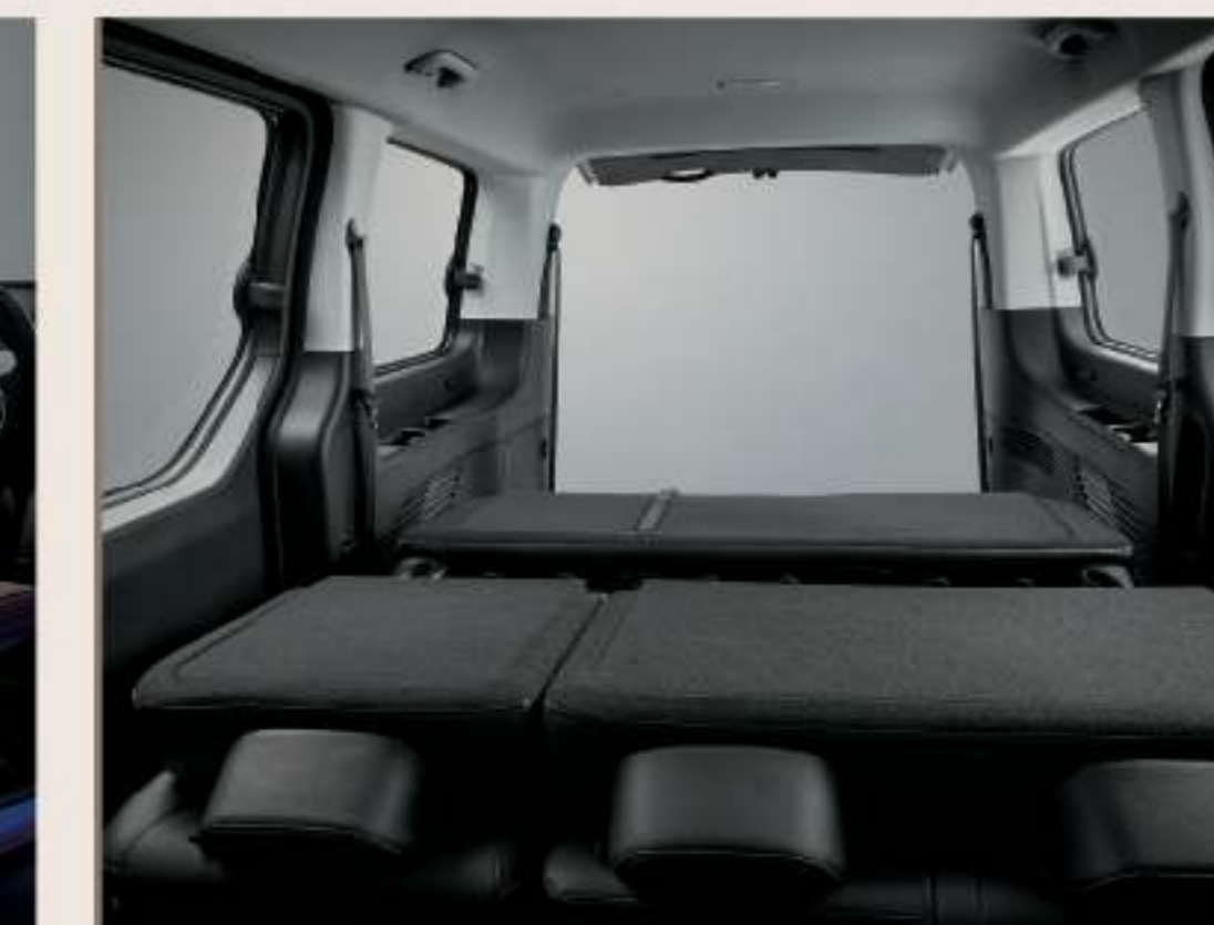
全平整傾倒功能（第二及第三排）