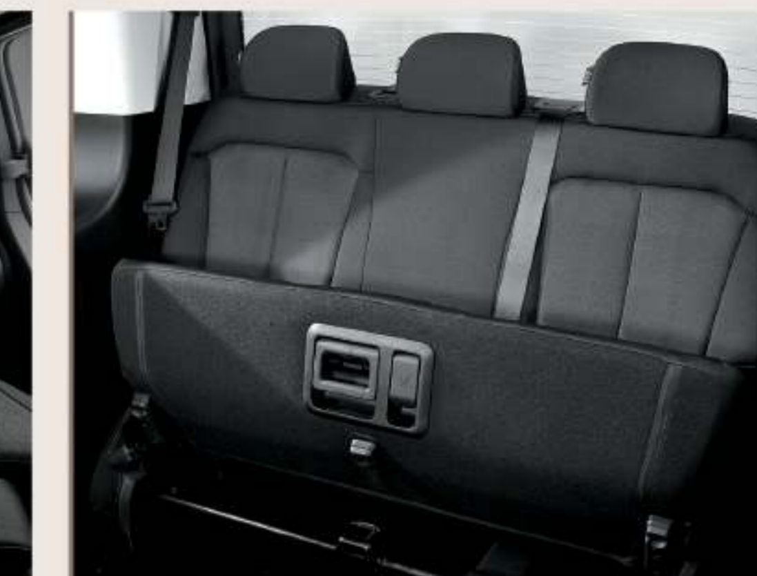
椅墊向上收摺（第三排）