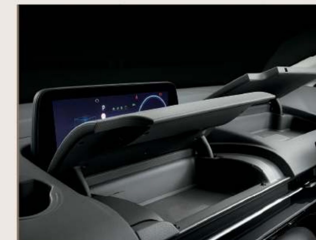
儀表前方及中控台上方置物盒