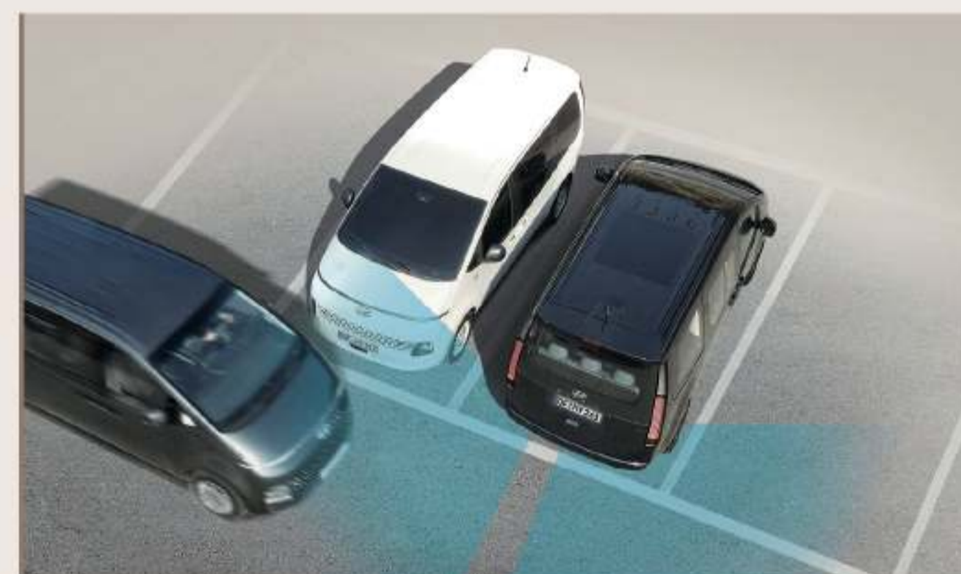
RCCA 後方交通防撞輔助