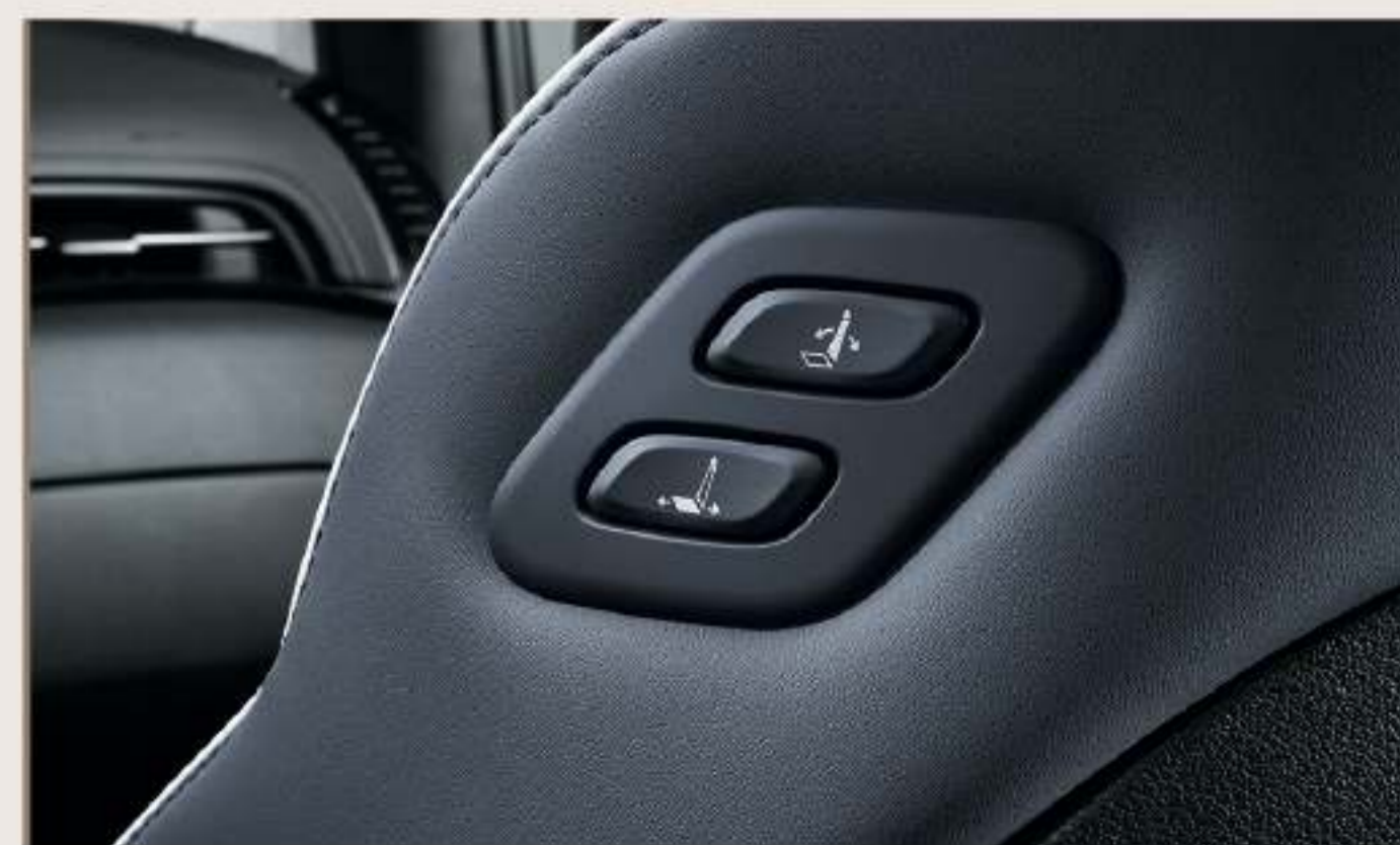
Walk-in Button 副駕駛座側面調整快捷按鈕