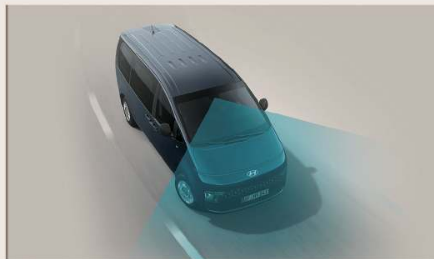
LFA 全速域車道維持輔助