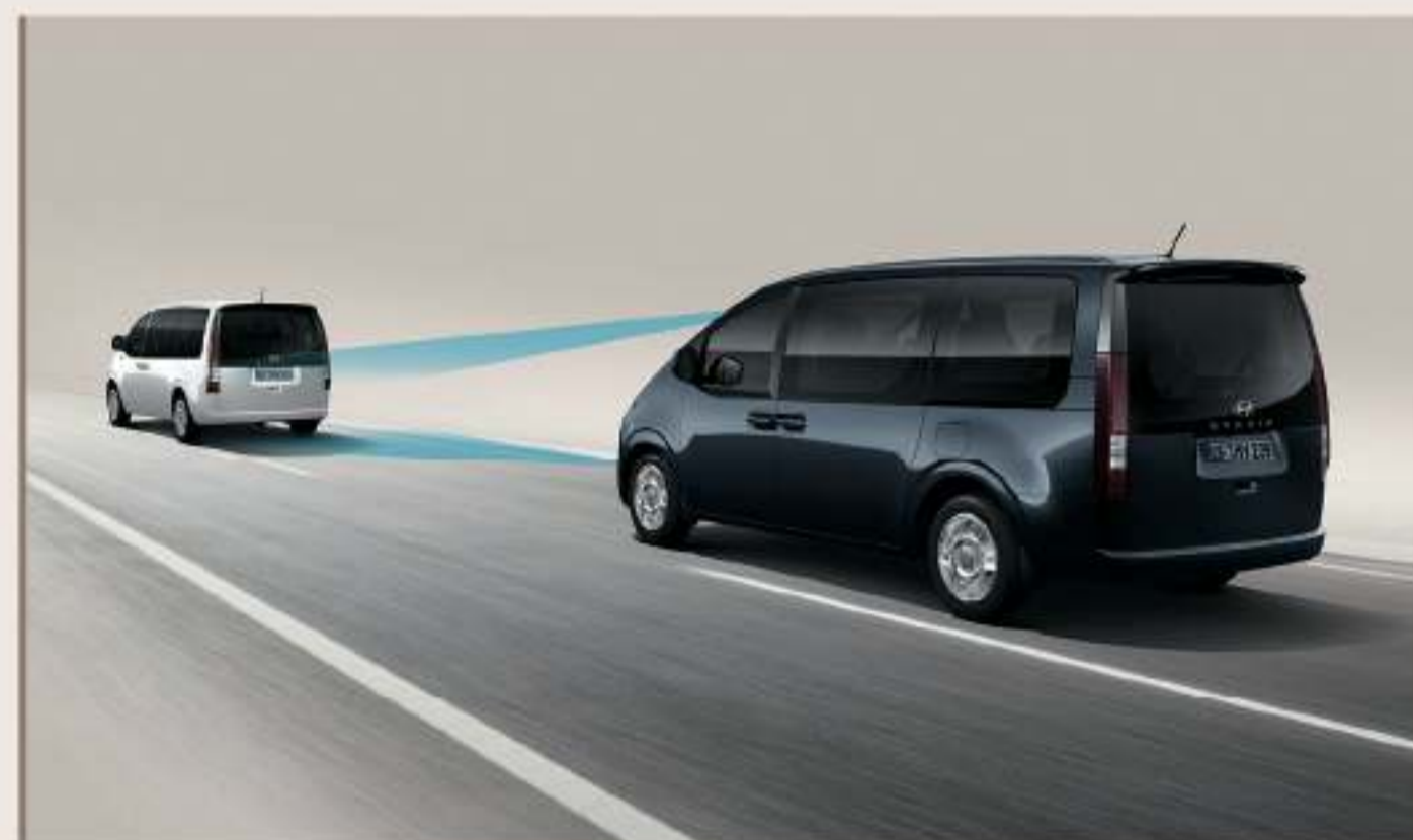
SCC 智慧型主動車距維持 (附 Stop&Go)