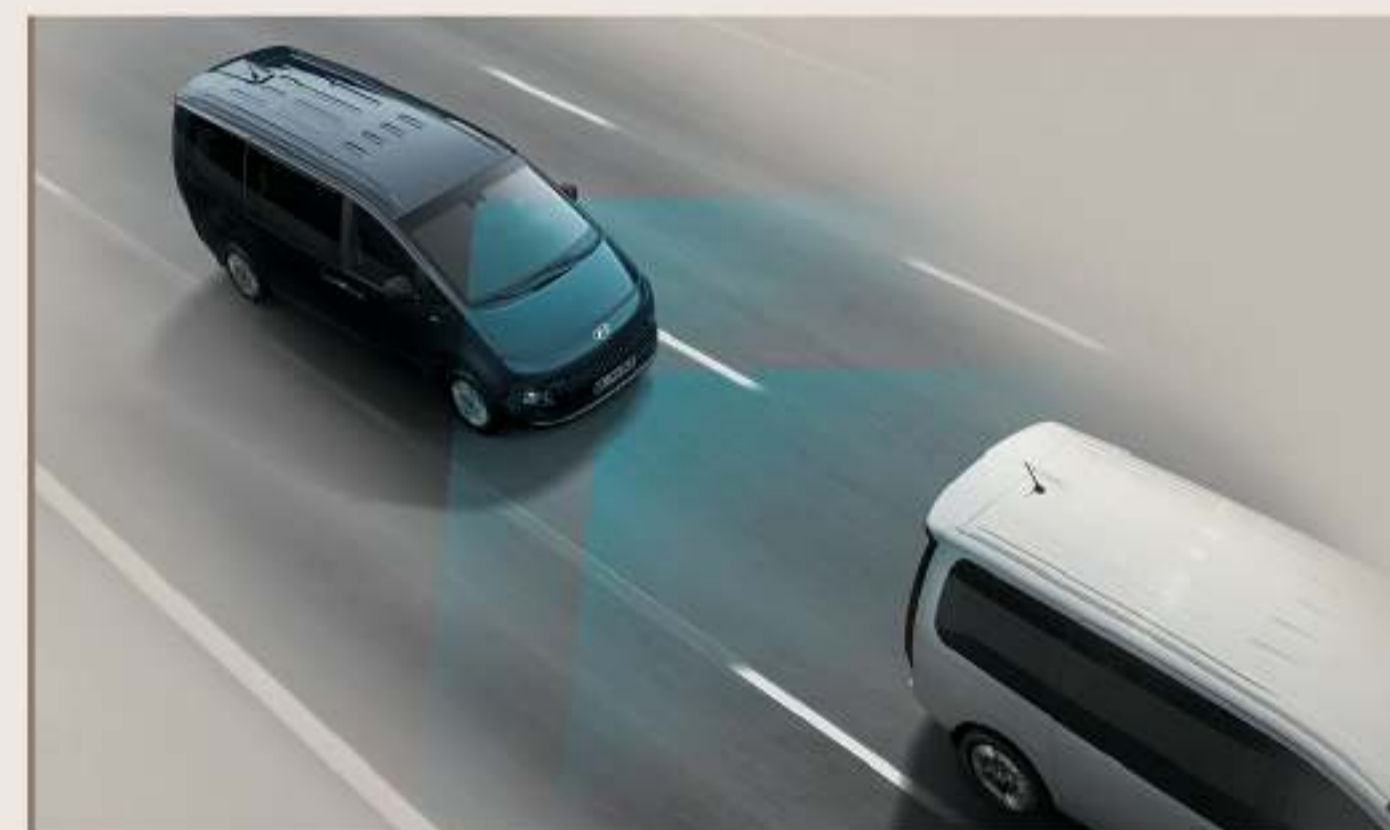
FCA 前方碰撞警示主動煞停輔助