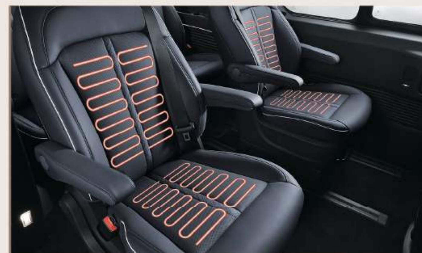
前排、第二排座椅通風、加熱功能 *