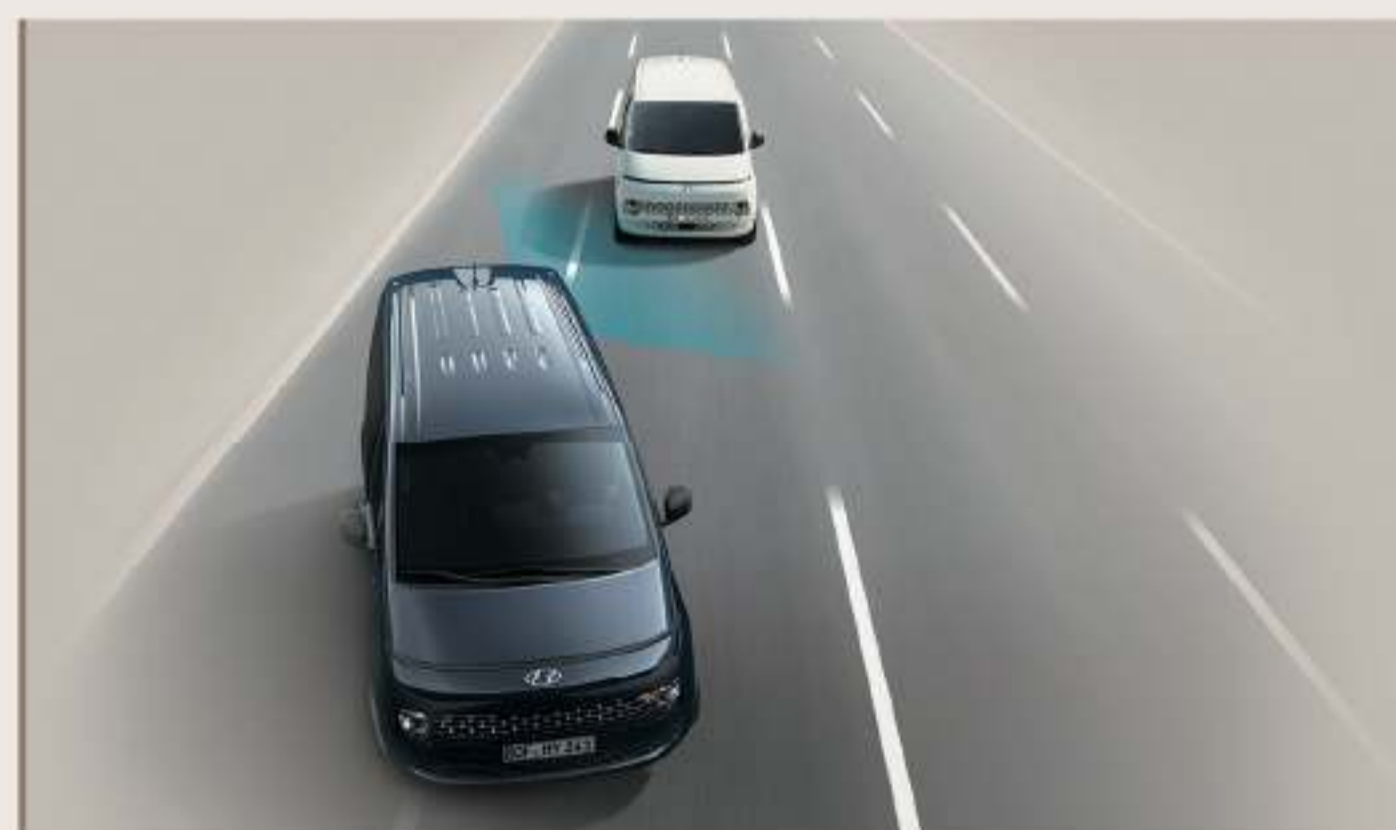
BCA 盲區碰撞避免輔助