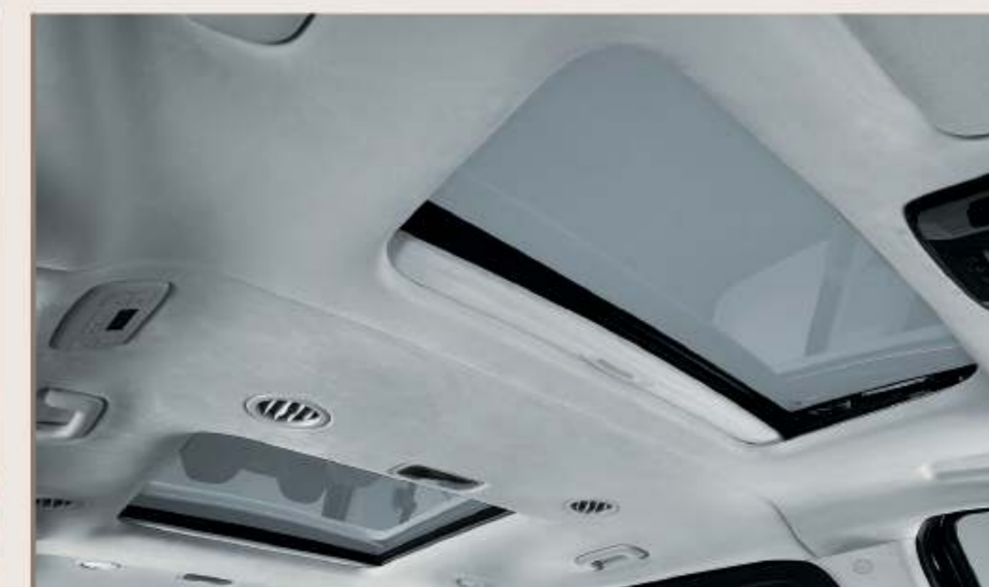
類麂皮頂棚 / 雙電動玻璃天窗 / 二三排獨立恆溫空調系統