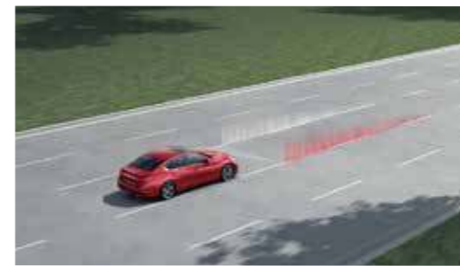
LDP 車道偏移預防系統

能同時監控前車與前前車，當預測到前車與前前車有追撞可能，將立即警示駕駛，為駕駛爭取更多反應時間；當有可能與前車發生碰撞意外時，將主動緊急煞車，讓碰撞發生機率降低。