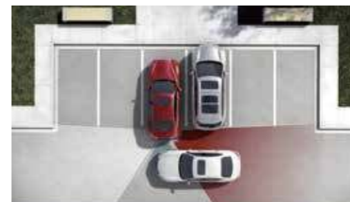
BCI 倒車後撞預防系統

透過後保桿內兩側的遠距感應雷達偵測後方來車，若雷達感知器偵測到偵測區域中有車輛，車側指示燈會自動點亮警示；若此時駕駛欲變換車道，啟動方向燈，車側指示燈會閃爍、發出警示音並主動啟動單側煞車，協助導正行車方向。