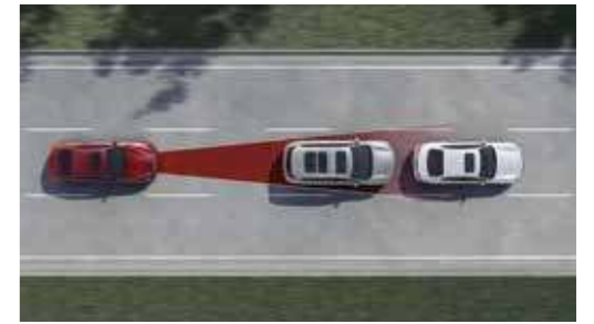
PFCW 超視距車輛追撞警示系統 FEB 自動急停輔助系統

當車速介於 0-144km/h 時，可依你的偏好設定三段安全車距，並根據前車的速度變化自動加速、減速，達到自動跟車的效果，並同時監控是否與前車保持足夠的安全距離，若與前車距離過近，將自動減速，預防煞車不及的狀況發生。