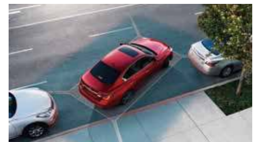
AVM 環景顯示附 MOD 物體偵測

可於倒車時主動偵測後方靜止或移動物體，消除視覺死角，於後方左右兩側偵測到物體時，將發出警示音提醒駕駛，於正後方預測到碰撞危險時，將主動緊急煞車，降低發生碰撞的風險。