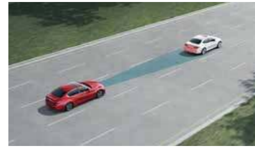
ICC 全速域智慧定速系統 DCA 車距控制輔助系統

當車速介於 0-144km/h 時，可依你的偏好設定三段安全車距，並根據前車的速度變化自動加速、減速，達到自動跟車的效果，並同時監控是否與前車保持足夠的安全距離，若與前車距離過近，將自動減速，預防煞車不及的狀況發生。