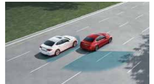
BSI 盲點側撞預防系統

車速於 70km/h 以上時啟動，偵測到車輛非刻意偏移車道時，將即時警示並主動啟動單側煞車協助導正行車方向。