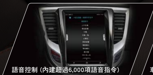
語音控制 (內建超過6,000項語音指令)

領先國產中大型房車，首創搭載耀眼奪目的「極智數位儀錶板」能全方位整合車輛資訊，行車狀況一覽無遺，更可依照心情，切換不同模式