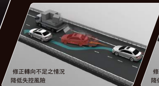
修正轉向不足之情況 降低失控風險