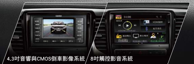
4.3吋音響與CMOS倒車影像系統 8吋觸控影音系統

男人嚮往聰明科技，就像女人渴望擁有名貴珠寶 GRAND LANCER人性化的操控，正是所有駕駛的渴求 除了智慧聲控系統，更有全面整合的雙屏顯示 還有什麼比一台懂你的車，更加讓人著迷？