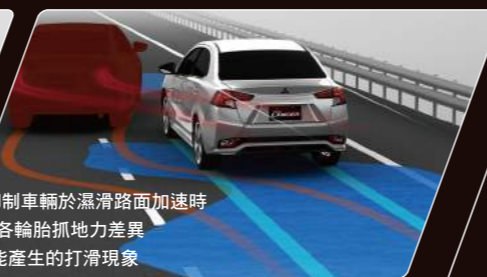
抑制車輛於濕滑路面加速時 因各輪胎抓地力差異 可能產生的打滑現象