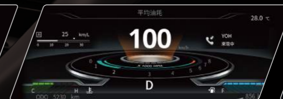
藍芽來電人名顯示