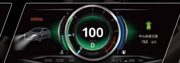
導航方向與剩餘里程提醒