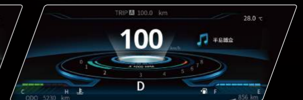
音樂及影片播放歌曲名稱顯示