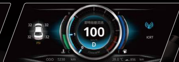
廣播頻道名稱與胎壓即時資訊