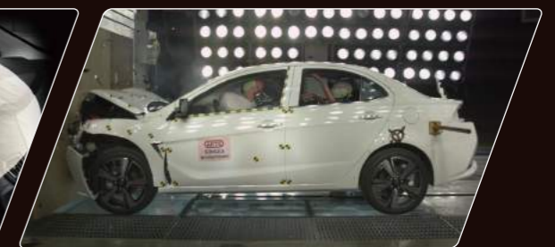
RISE高剛性車體 ARTC 40次撞擊測試實證