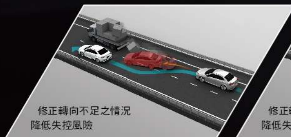
ASC車身動態穩定系統