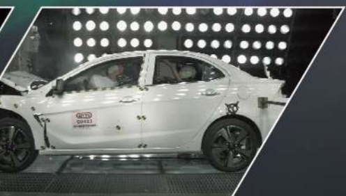
RISE高剛性車體 ARTC 40次撞擊測試實證