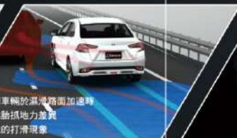
TCL循跡防滑控制系統