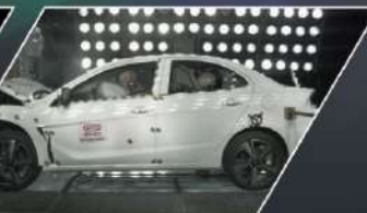
RISE高剛性車體 ARTC 40次撞擊測試實證