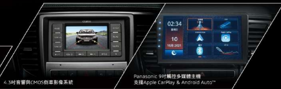
4.3吋音響與CMOS倒車影像系統