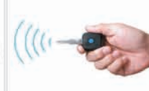
遙控防盜中控門鎖