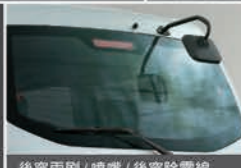
後窗雨刷 / 噴嘴 / 後窗除霧線 第三煞車燈 / 尾門照地鏡