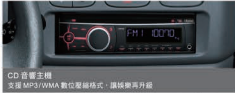
CD 音響主機 支援 MP3/WMA 數位壓縮格式, 讓娛樂再升級