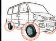
TPMS 無線胎壓偵測系統