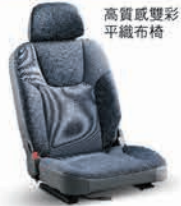
高質感雙彩 平織布椅

配備 CD 音響主機 (支援 MP3/WMA 讀取功能)、獨立 USB 接頭, 讓東奔西跑的工作心情得到最大的鼓舞。加上運用自如的靈活車室空間, 載貨超方便, 還有設想周到的各式貼心配備, 讓頭家不論是做生意還是休閒時刻, 都能一邊開車, 一邊享受最愜意的駕乘環境。