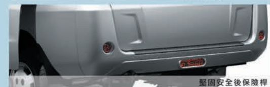
堅固安全後保險桿