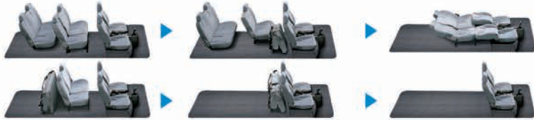
八人座座椅運用變化示意圖 (椅布材質以實車為準)