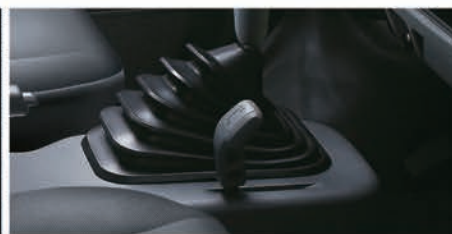
四輪傳動+加力檔設計