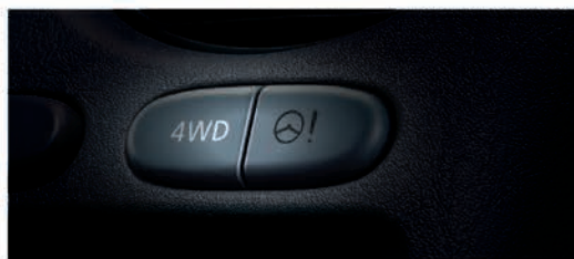
按鍵式切換 2WD / 4WD 設計

四輪傳動車動能實力堅強，氣派外觀搭配超強悍4WD系統，將你輕鬆載往城市以外的桃花源。無論是載重、爬坡，四輪驅動讓頭家生意全面起動。荷重有實力，載貨更有力！