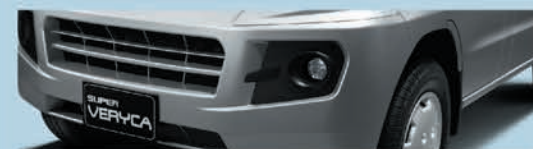
大型氣派前保險桿&霧燈