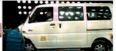
CAE 強化車體剛性設計