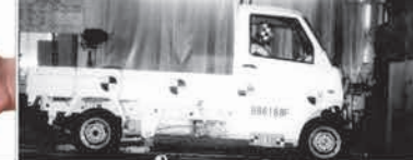
CAE 強化車體剛性設計