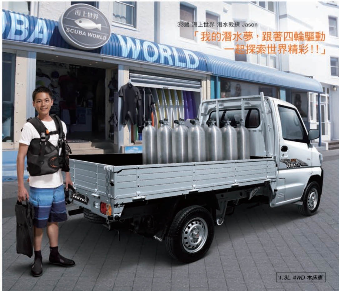
1.3L 4WD 木床車