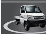
4.8M 4.8M 最小迴轉半徑