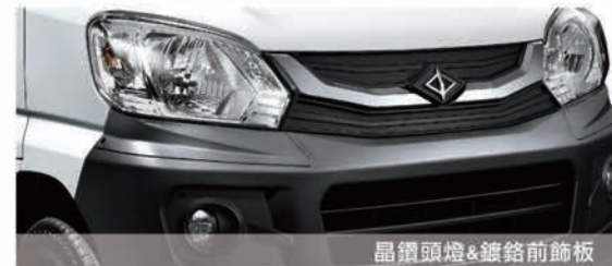
晶鑽頭燈 & 鍍鉻前飾板