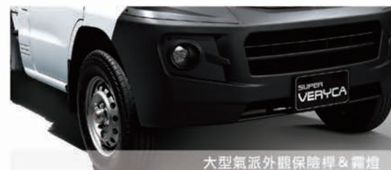
大型氣派外觀保險桿 & 霧燈