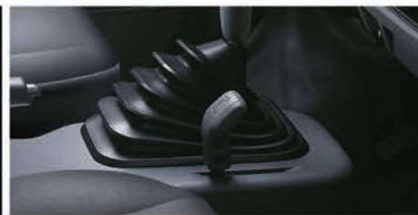
四輪傳動+加力檔設計