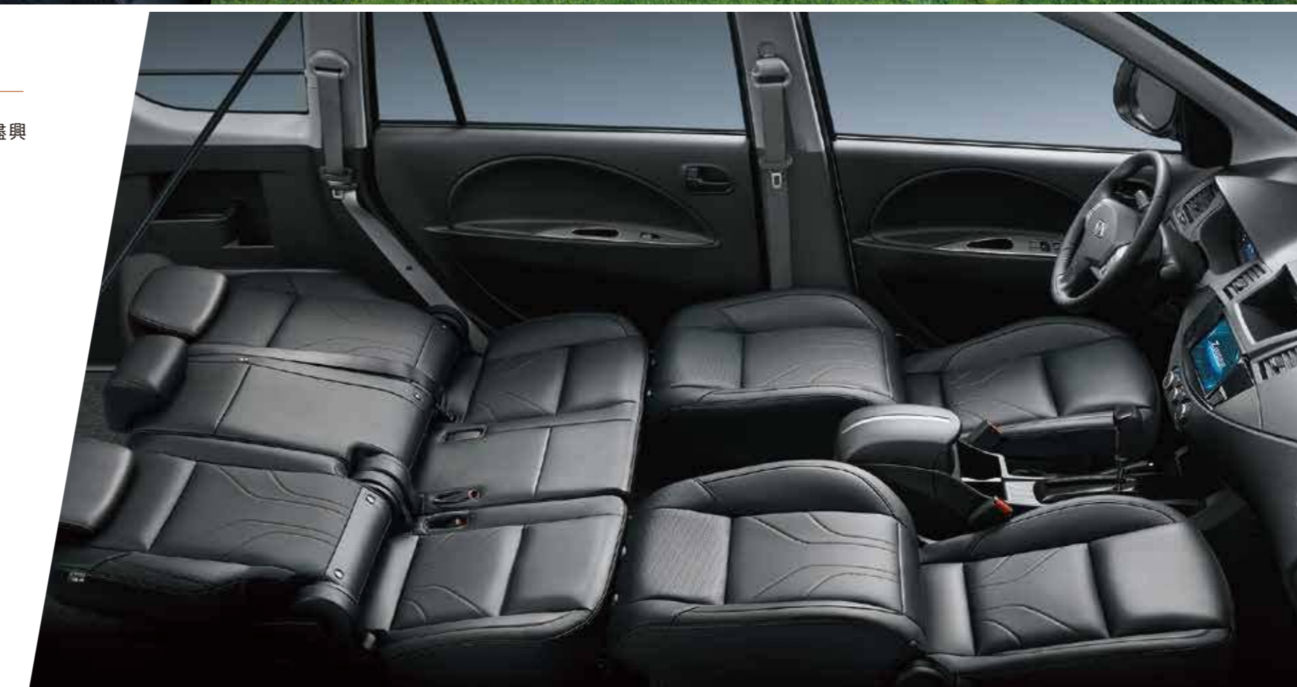
車室座椅全平躺功能