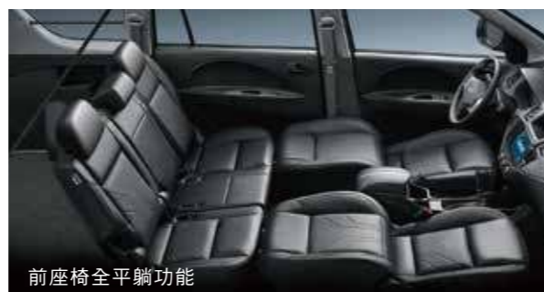
前座椅全平躺功能