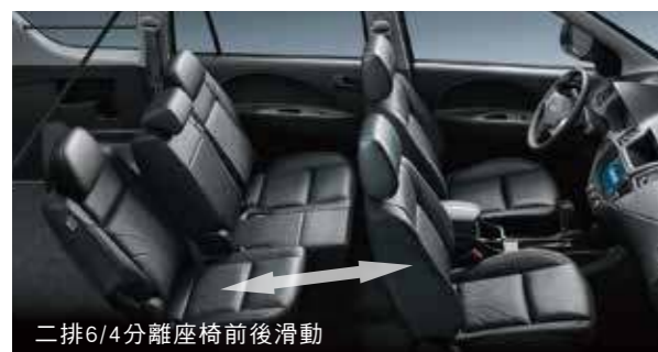
二排6/4分離座椅前後滑動

車廂空間大、尾門開口寬敞、底板空間平整，三大優勢讓載貨輕鬆搞定，出遊開心盡興 座艙多變組合，適用不同空間需求；全新勁黑質感座椅，舒適大方