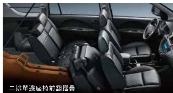
二排單邊座椅前翻摺疊