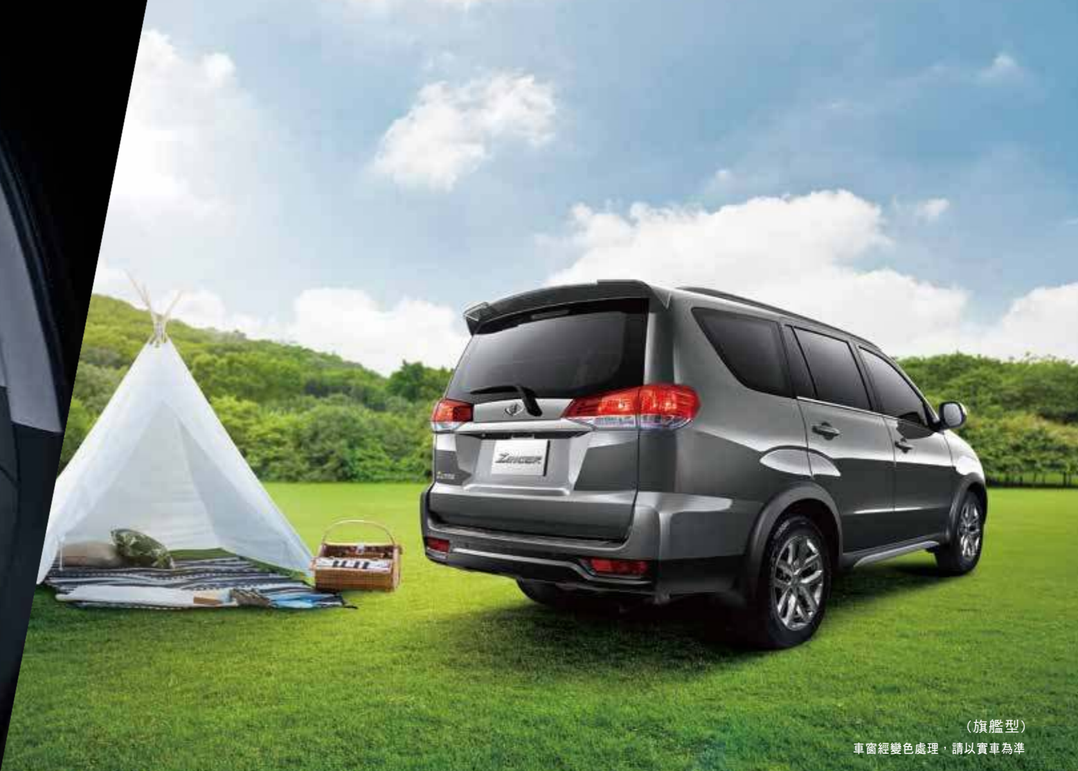
(旗艦型) 車窗經變色處理，請以實車為準