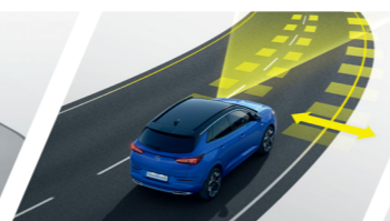
LKA+LDW 車道維持輔助+車道偏移警示