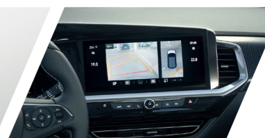
360° Surround Vision 停車環景影像輔助系統

*輔助駕駛系統為輔助駕駛功能，而非自動駕駛功能。*以上系統均為輔助功能，故駕駛行車時應隨時注意道路及車輛周邊狀況，以保持安全，不能因受該系統輔助而減少注意力。敬請參閱車主手冊及系統介紹網頁，以確實了解該系統之詳細使用方式、限制及規範。