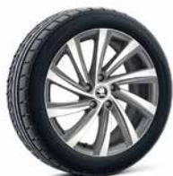
18吋 PERSEUS 鋁圈