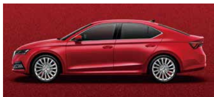
炫彩紅 K1K1 (須加價選購)