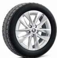
17吋 ROTARE AERO 鋁圈