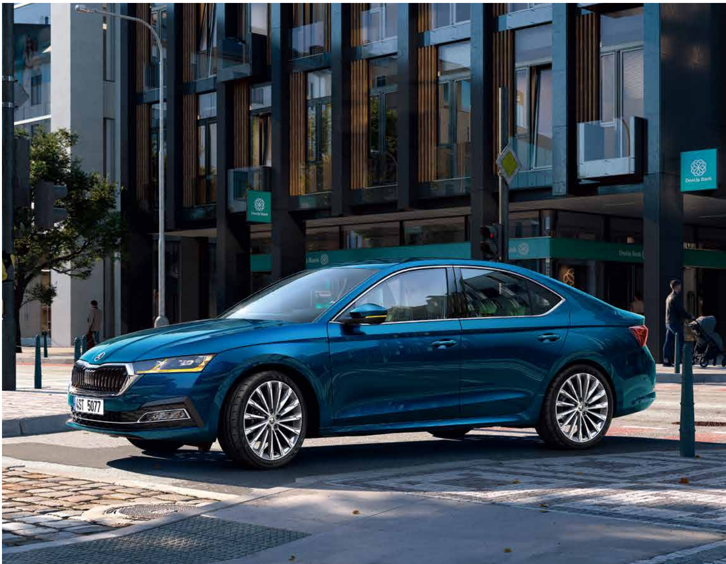
Škoda Octavia 歐洲智世代旅行車。