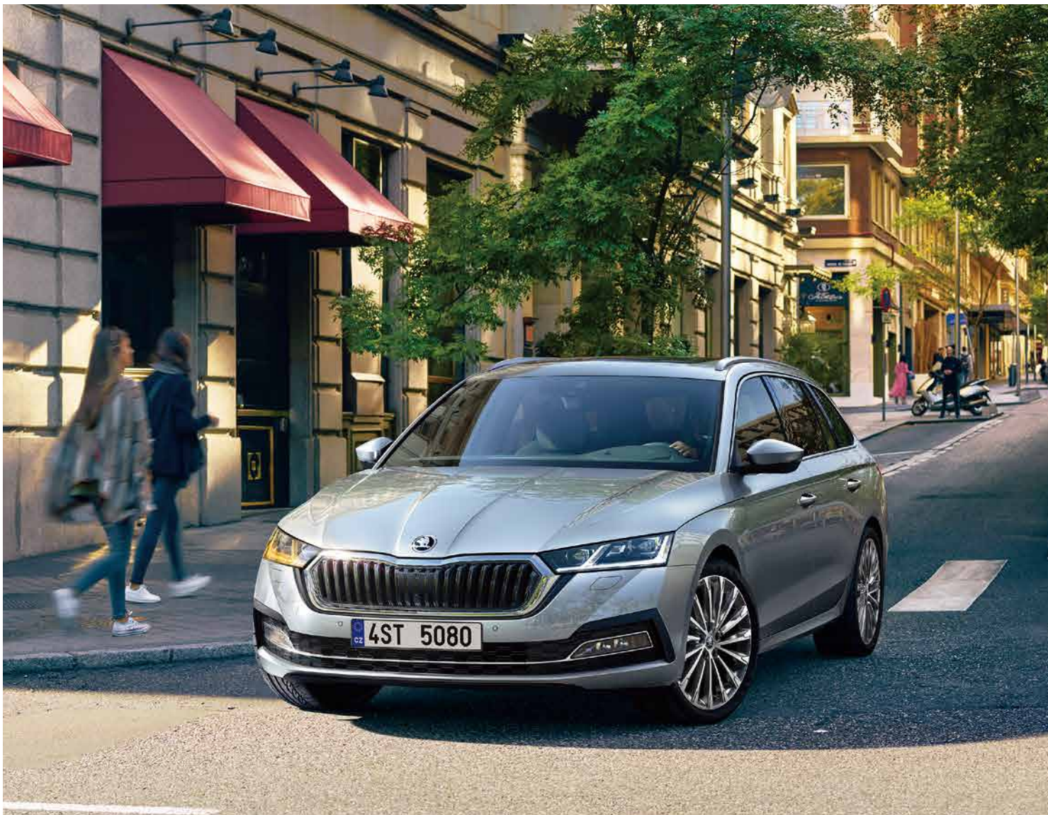
Škoda Octavia Combi 歐洲智世代旅行車。