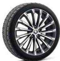
19吋 BECRUX 鋁圈