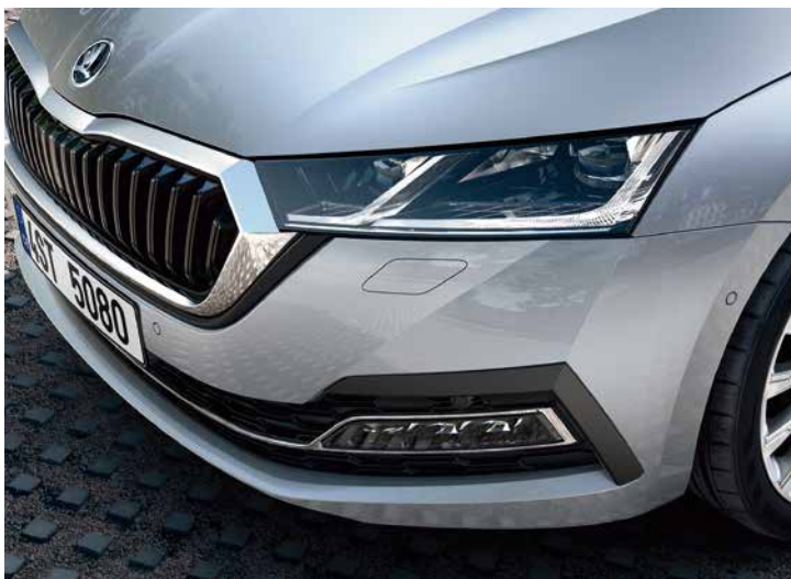
運用擋風玻璃攝影機，Octavia Combi 的 Matrix LED 智慧複眼頭燈組可以偵測前方或對向車輛自動調整遠光燈光束。提供最佳視線，又不會造成其他用路人目眩。