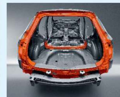
雙環狀車體結構設計