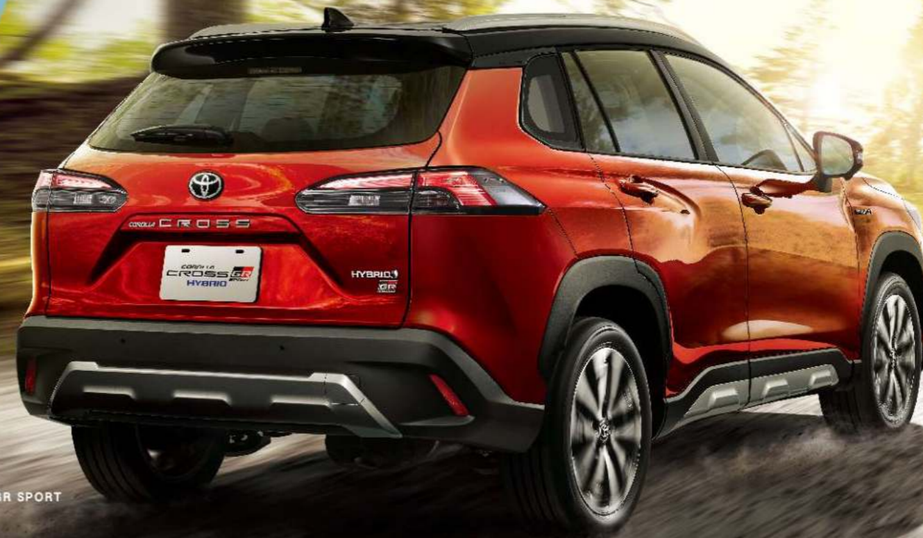
HYBRID GR SPORT

GR SPORT專屬前衛設計 以燻黑LED光條式尾燈 與18吋雙色切削鋁圈 展現熱血跑格，釋放不羈靈魂