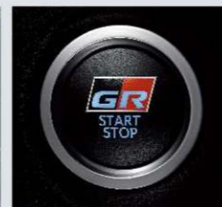
引擎啟閉按鈕附GR字樣