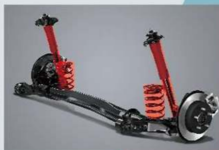
GR SPORT 運動化懸吊