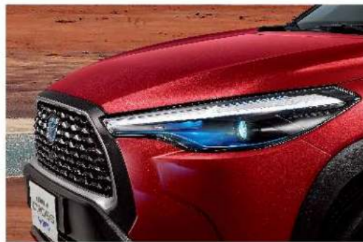
LED Bi-Beam 投射式頭燈 (汽油尊爵、HYBRID尊爵、HYBRID旗艦、HYBRID GR SPORT)*灌壓式燈殼為一般HYBRID車型專屬