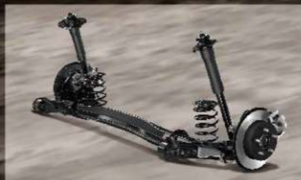
全新 TNGA 扭力桿式後懸吊

全新TNGA扭力桿式後懸吊，採用高剛性扭力桿支臂，搭配防傾平衡桿，提供優異操控表現。完美的懸吊幾何設定、新設計懸吊支架與大型襯套，能降低路面傳導至車體的衝擊力道，提供更平穩舒適的行車質感。