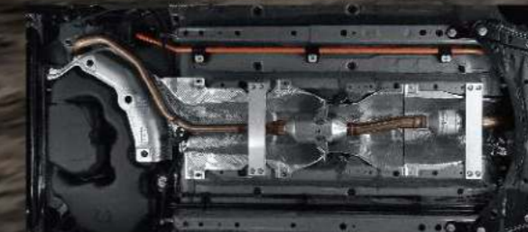
底盤雙鋁合金剛性強化支架

於底盤中央通道採用鋁合金剛性強化支架，有效強化車身剛性，提供車主更多操駕樂趣。* GR SPORT 車型除外