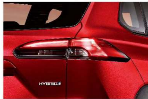
LED 光條式尾燈 (汽油尊爵、HYBRID尊爵、HYBRID旗艦)