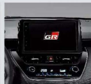
9吋觸控式主機附GR開機畫面