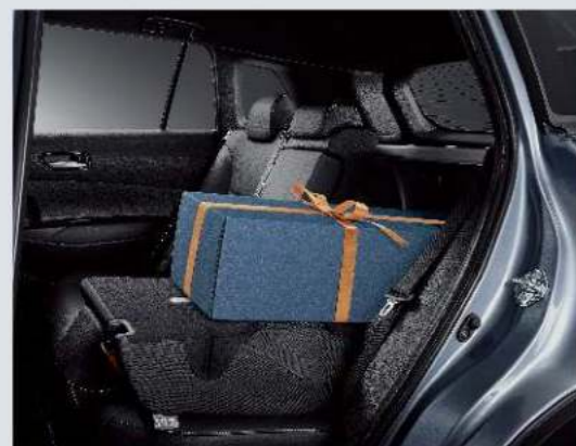
後座椅 6/4 分離椅背傾倒