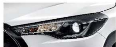
Bi-Beam 頭燈組(鹵素) (汽油豪華、HYBRID 豪華、汽油 GR SPORT)