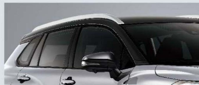
潮炫雙色車頂設計

GR SPORT專屬前衛設計 以燻黑LED光條式尾燈 與18吋雙色切削鋁圈 展現熱血跑格，釋放不羈靈魂