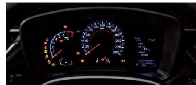
雙環式附4.2吋全彩MID儀錶板 (汽油豪華、汽油GR SPORT)