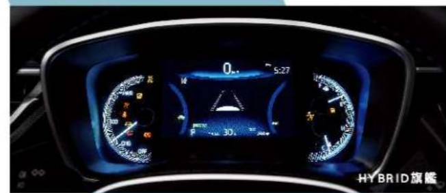
7吋全彩數位式儀錶板 (汽油尊爵以上、HYBRID GR SPORT)