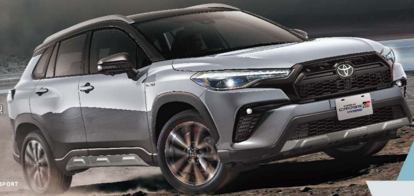
HYBRID GR SPORT

COROLLA CROSS GR SPORT 強悍敏捷的操控性能 加上引領潮流的霸氣運動化外觀 讓每次奔馳，更率性狂放！