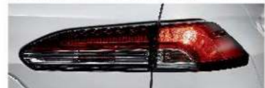
LED 尾燈組 (汽油豪華、HYBRID 豪華)