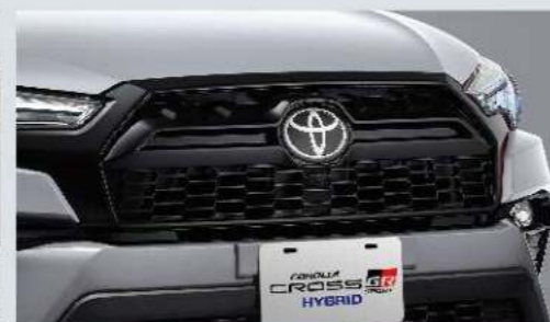
蜂巢式燻黑水箱護罩