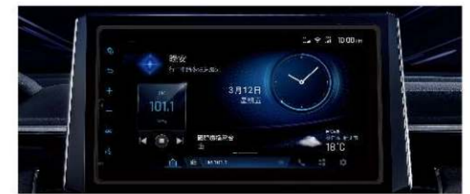
TOYOTA Drive+ Link 智能車載系統 支援Apple CarPlay 與 Android Auto

*Drive+ Link智能車載系統之動作皆有其限制條件，詳情請參閱使用手冊或官網相關QA說明。