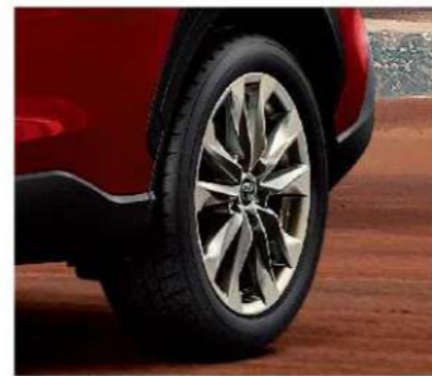
17吋十幅式鋁圈 (汽油豪華、汽油尊爵、HYBRID豪華、HYBRID尊爵)