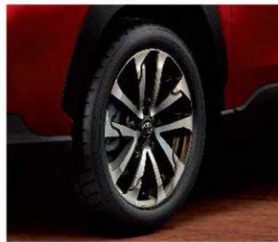
18吋雙色切削鋁圈 (HYBRID旗艦、GR SPORT車型)