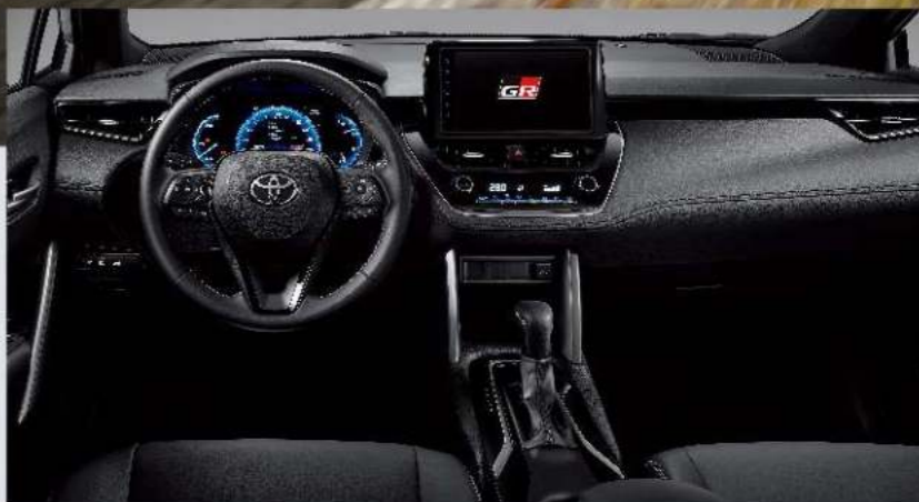
GR SPORT 專屬勁黑質感內裝