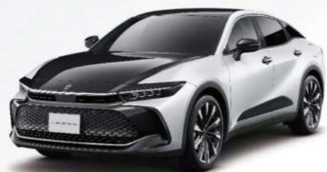
2XW 霓光白 / 雙色