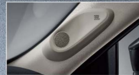
JBL Premium Sound音響(皇家版)