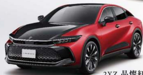
2YZ 晶燦紅 / 雙色