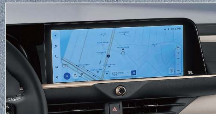
12.3吋多功能導航主機附智慧手機連結