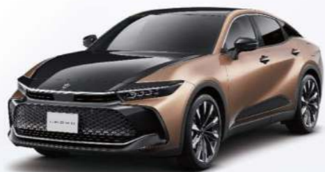
2XZ 晶曜銅 / 雙色