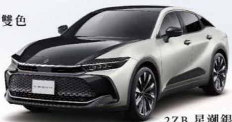
2ZB 星潮銀 / 雙色