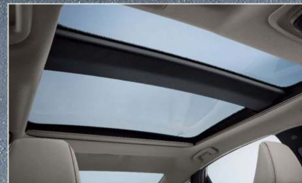
全景式天窗(皇家版)