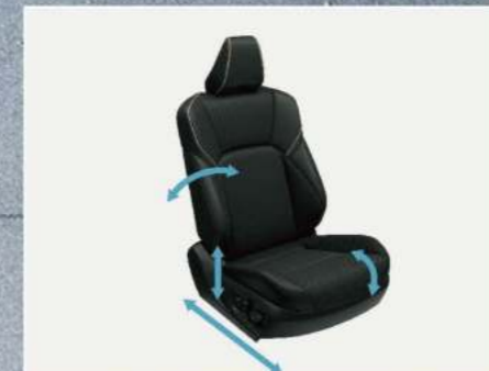
雙前座八向電動調整加熱通風座椅(皇家版)