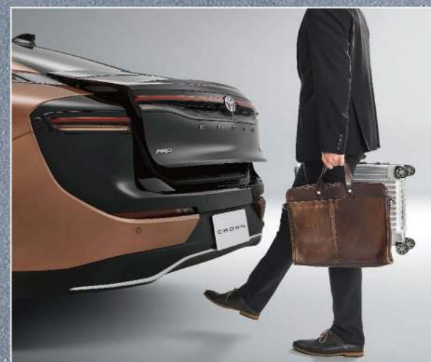
足踢感應式電動尾門(皇家版)