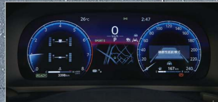
12.3吋全彩數位式儀錶板