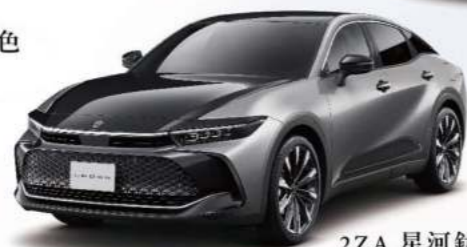
2ZA 星河鈦 / 雙色