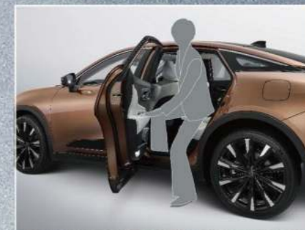
最適車高 上下車優雅便利