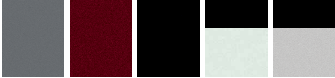
رمادي معدني Gun Metallic