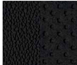
جلد غرافيت / الجلد المدبوغ الصناعي Graphite Leather / Synthetic Suede