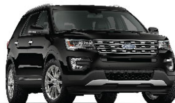
Shadow Black / Đen