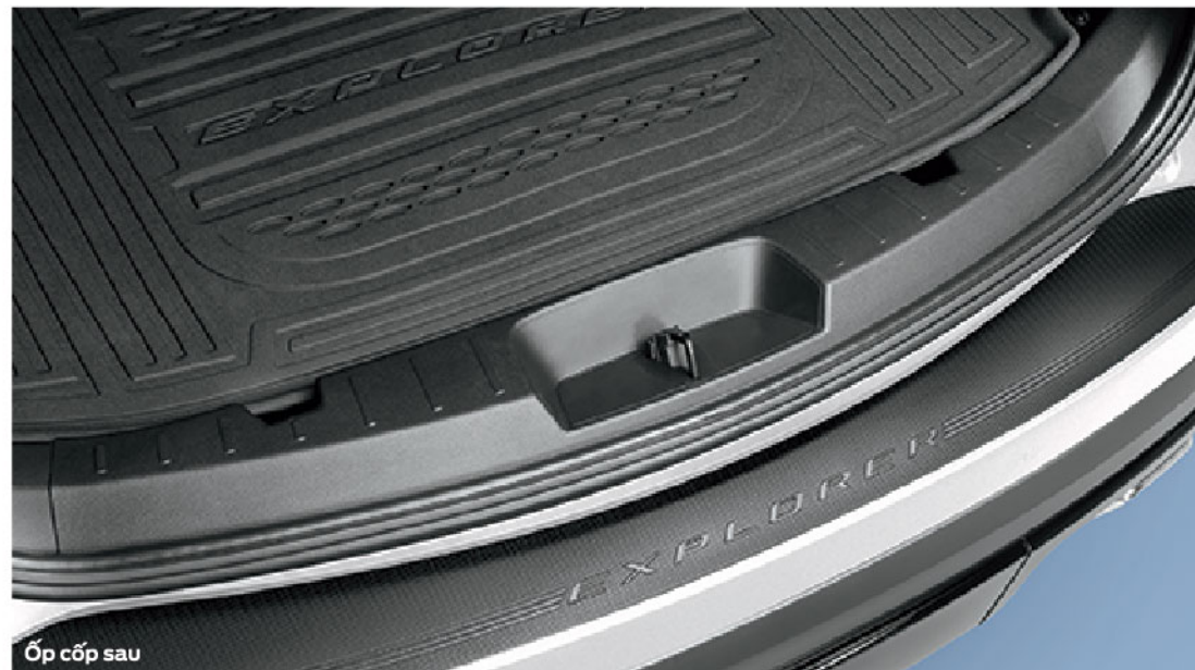
Ốp cốp sau