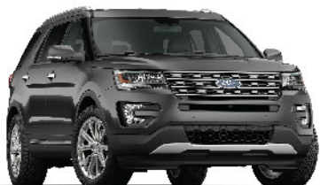
Magnetic / Ghi