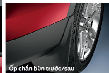
Ốp chắn bùn trước/sau