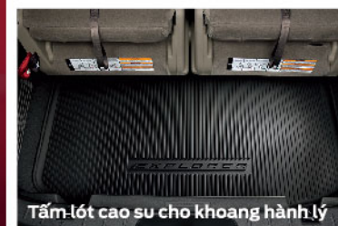
Tấm lót cao su cho khoang hành lý