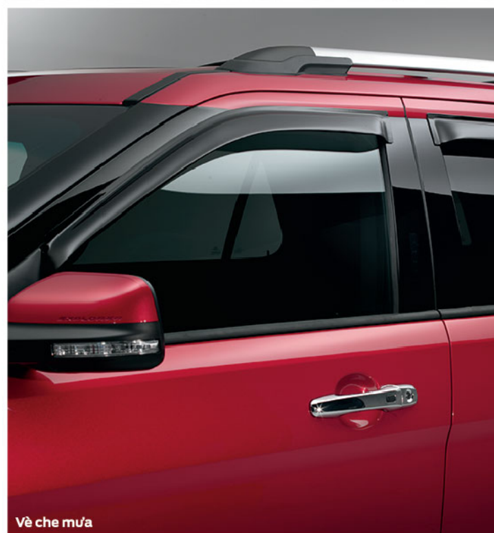
Vê che mưa