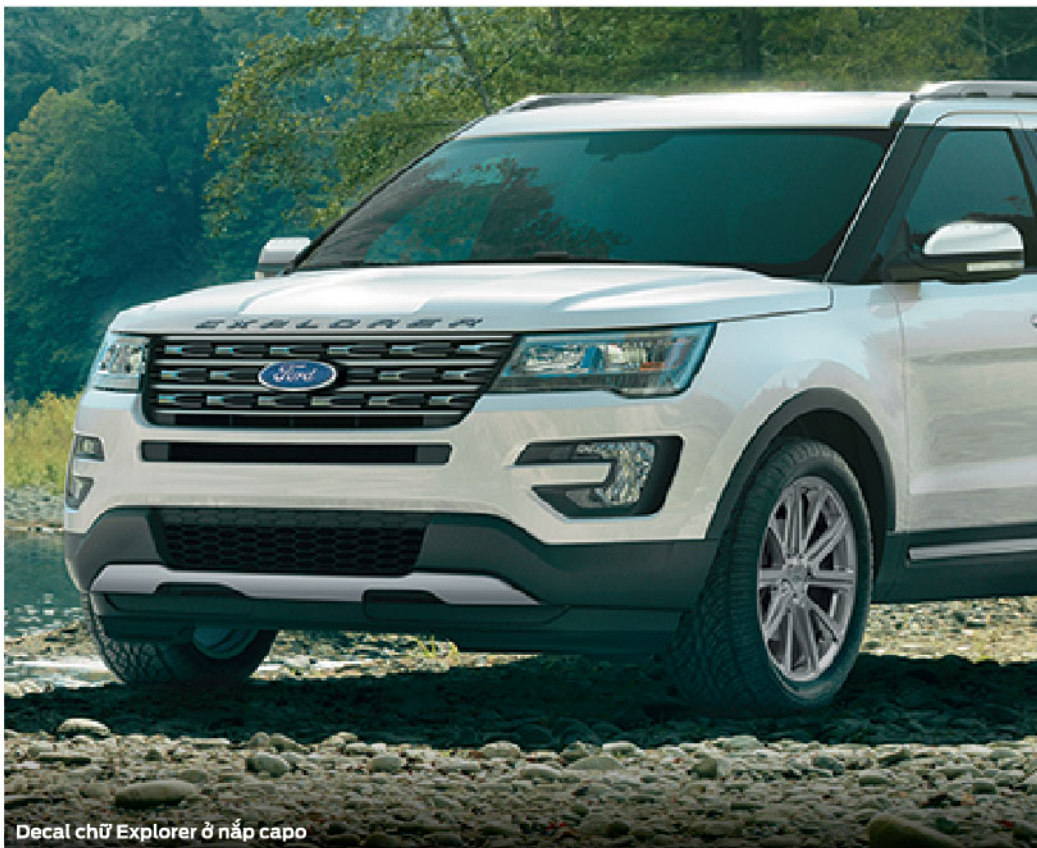
Decal chữ Explorer ở nắp capo