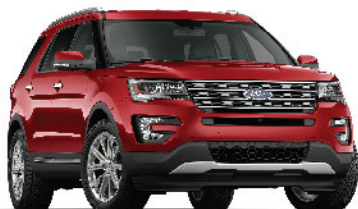
Ruby Red / Đỏ