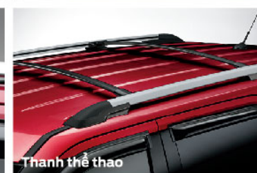
Thanh thể thao