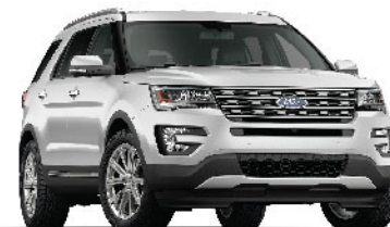
Platinum White / Trắng