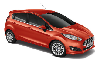
Đỏ Sao Hỏa Mars Red