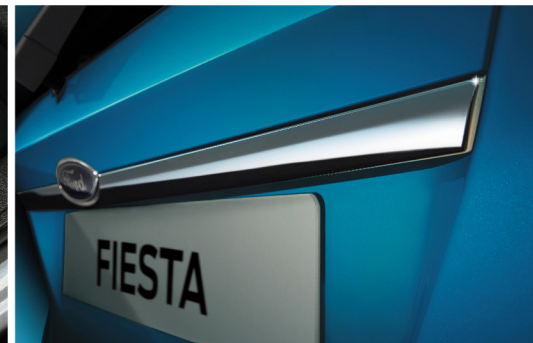
Ốp tay mở cửa lật mạ crom