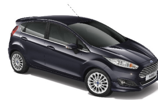
Đen Panther Panther Black