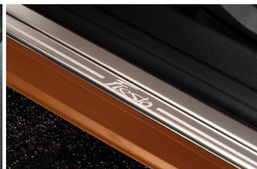
Ốp bậc cửa