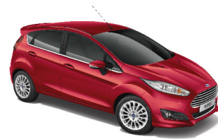
Đỏ Ngọc Ruby Red Fire