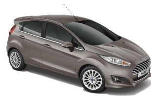
Nâu Hồ Phách Lunar Sky