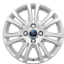
Vành đúc hợp kim 15 inch