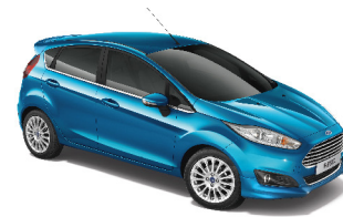
Xanh Dương Cyan