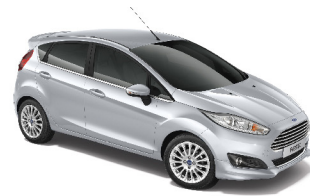
Bạc Ánh Kim Platinum Silver