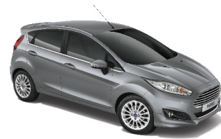
Đá Ánh Thép Cool Grey