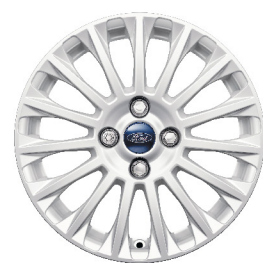
Vành đúc hợp kim 16 inch