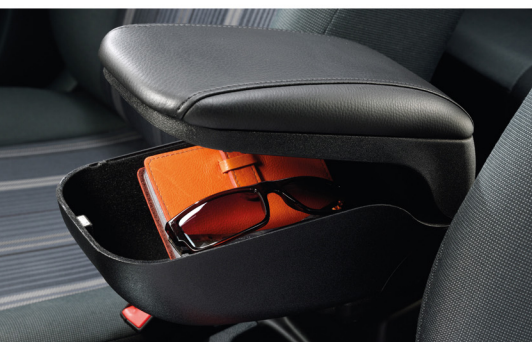
Hộp đựng đồ trung tâm – bọc da