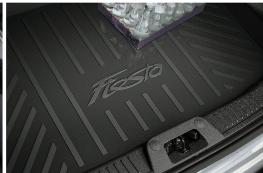
Tấm lót khoang hành lý (xe 5 cửa)