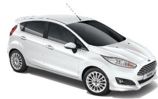
Trắng Kim Cương Diamond White

Hãy chọn màu bạn muốn với Ford Fiesta, cơ hội sở hữu chiếc xe hoàn toàn theo ý bạn!