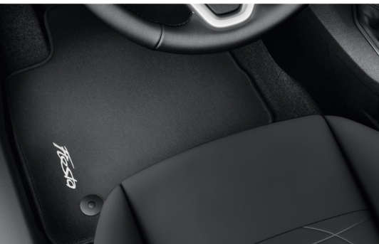
Thảm lót chân