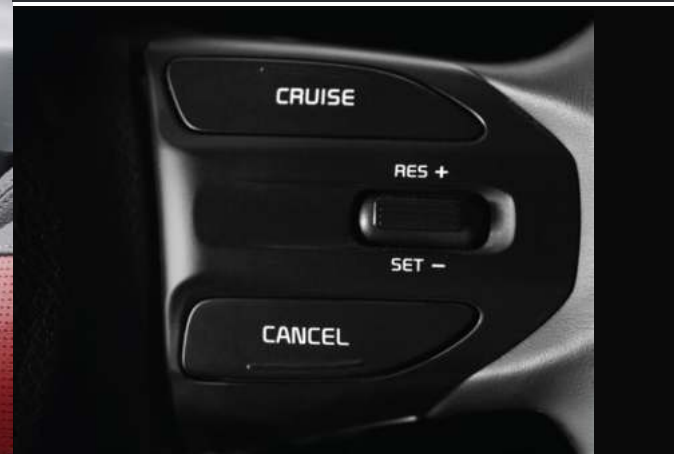
Hệ thống ga tự động Cruise Control