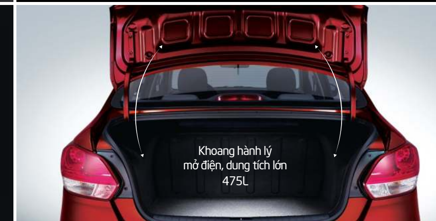
Khoang hành lý mở điện, dung tích lớn 475L