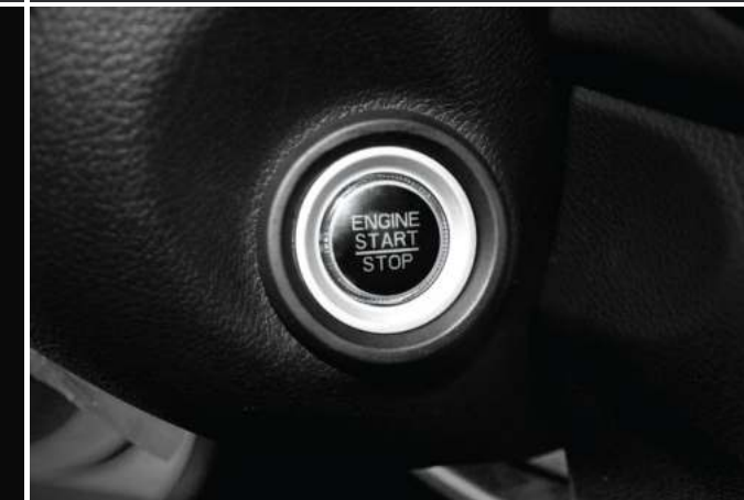
Nút nhấn khởi động Start/ Stop