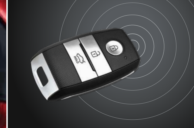
Chìa khóa thông minh Smart key