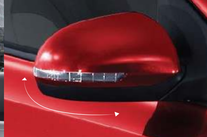
Gương chiếu hậu chỉnh điện, gập điện