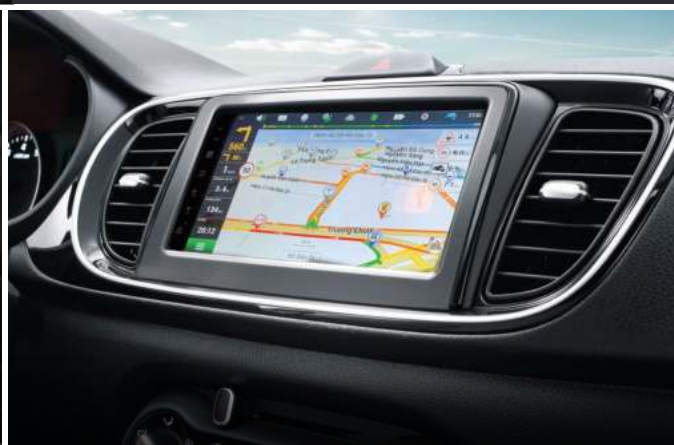
Màn hình cảm ứng 7-inch AVN