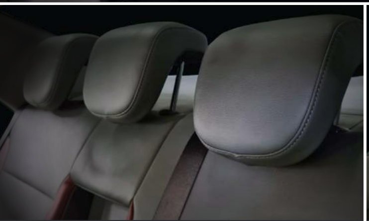
Tựa đầu tại vị trí trung tâm, điều chỉnh được độ cao