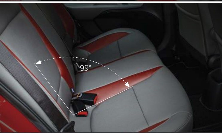
Điều chỉnh Tăng độ ngả lưng ghế