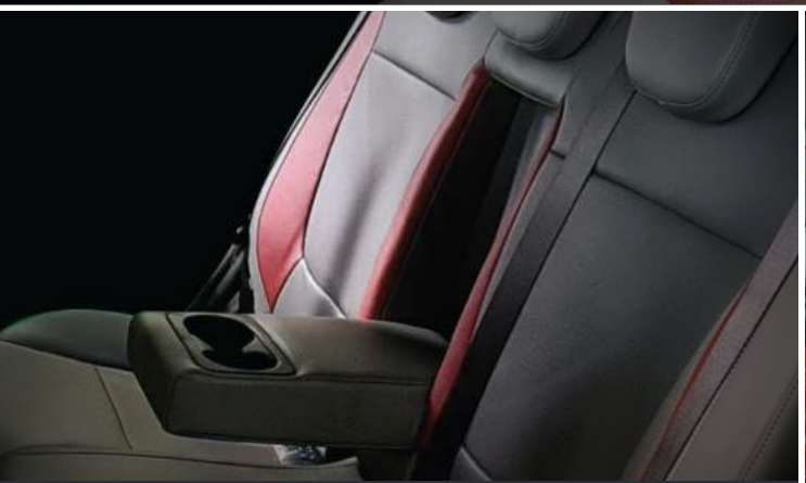
Bệ tay trung tâm kết hợp hai vị trí để cốc