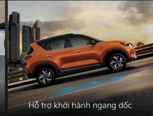
Hỗ trợ khởi hành ngang dốc