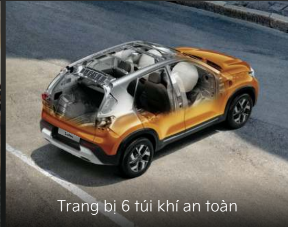
Trang bị 6 túi khí an toàn