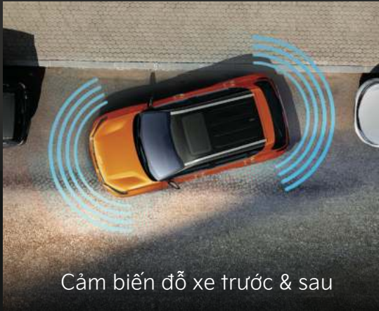
Cảm biến đỗ xe trước & sau