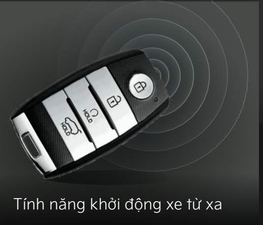
Tính năng khởi động xe từ xa

Kia Seltos & Kia Sonet trang bị các tính năng điều khiển thông minh mang lại sự tự tin cho người lái và đảm bảo an toàn tối ưu trong mọi điều kiện vận hành