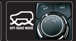
4 chế độ vận hành off-road