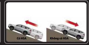
Hỗ trợ khởi hành ngang dốc (HSA)