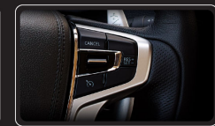
Lấy sang số