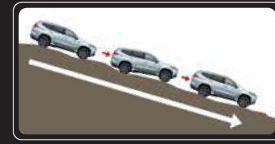
Hỗ trợ xuống dốc (HDC)