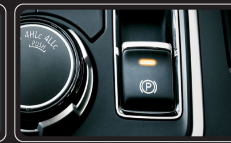
Phanh tay điện tử