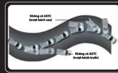
Hệ thống cân bằng điện tử kiểm soát lực kéo ASTC