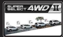
Hệ thống truyền động 2 cầu