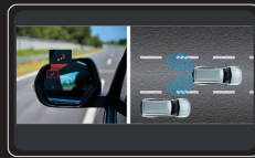
Cảnh báo điểm mù