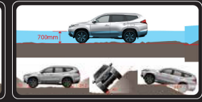
Khả năng vượt địa hình vượt trội