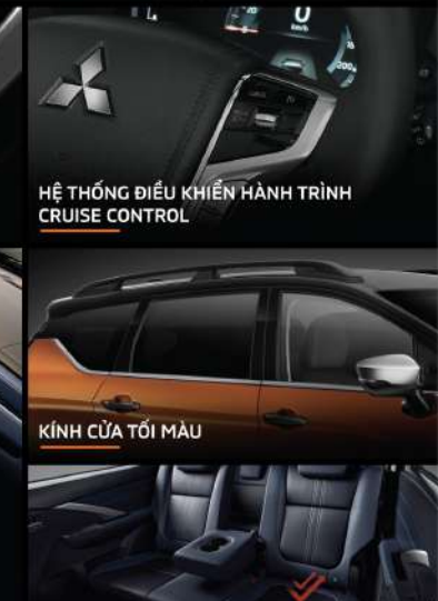
KÍNH CỬA TỐI MÀU