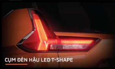
CỤM ĐÈN HẬU LED T-SHAPE