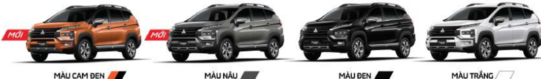
MÀU CAM ĐEN

Chi chú: Thông số kỹ thuật và trang thiết bị có thể thay đổi từ nhà sản xuất mà không báo trước. Some specifications and equipment could be changed without prior notice.