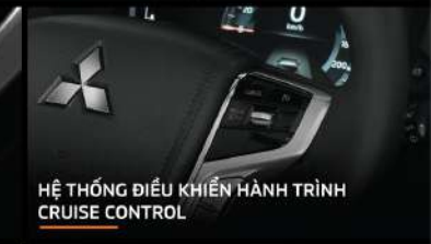
HỆ THỐNG ĐIỀU KHIỂN HÀNH TRÌNH CRUISE CONTROL