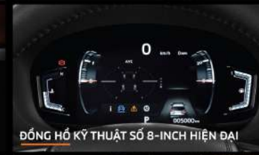
ĐỒNG HỒ KỸ THUẬT SỐ 8-INCH HIỆN ĐẠI