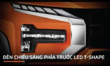
ĐÈN CHIẾU SÁNG PHÍA TRƯỚC LED T-SHAPE

Thiết kế mượt mà qua từng chi tiết, trang bị tiện nghi hiện đại cùng vật liệu cao cấp tạo nên không gian tinh tế và tiện nghi.