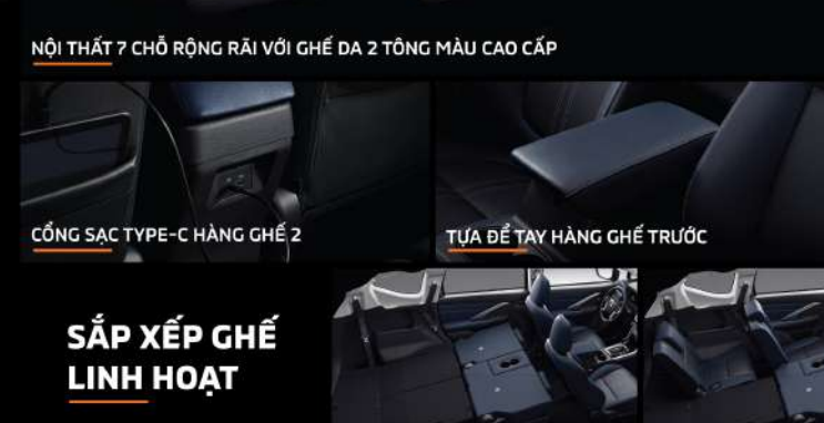
CỔNG SẠC TYPE-C HÀNG GHẾ 2

Khung xe toàn cấu của Mitsubishi được thiết kế để hấp thụ và chận và phân tán lực, đảm bảo sự an toàn của cả gia đình xuyên suốt hành trình.