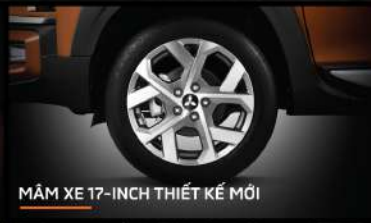
MẪM XE 17-INCH THIẾT KẾ MỚI