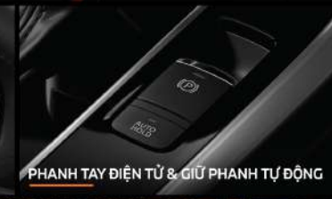
PHANH TAY ĐIỆN TỬ & GIỮ PHANH TỰ ĐỘNG