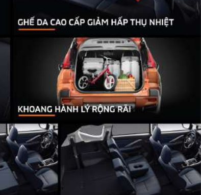
KHOANG HÀNH LÝ RỘNG RÃI